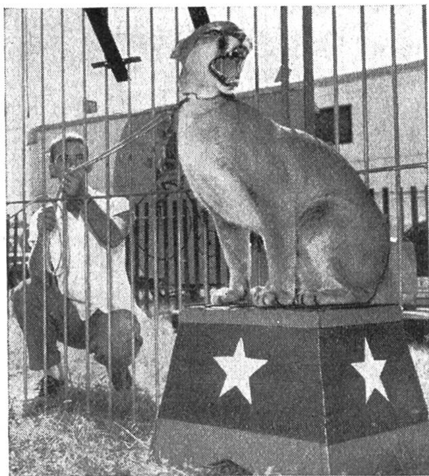
Bis sich der Puma an den Dompteur gewöhnt hat, wird er von aussen am Halsband festgehalten.