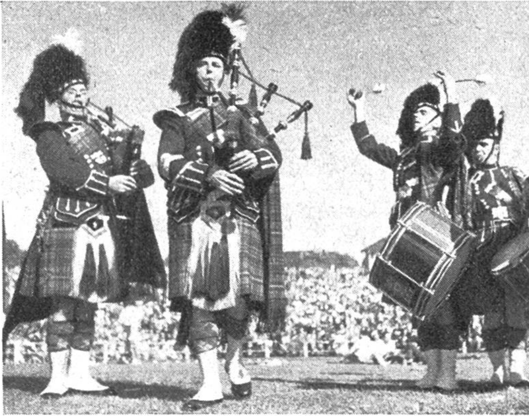
Dudelsackpfeifer in der Nationaltracht der Schotten. Die Musik wird für die Sackpfeife besonders komponiert; sie wird als aufreizend und kampflustig empfunden.

Bei den Tanzwettkämpfen spielt das schottische Nationalinstrument, die Dudelsackpfeife, zum Tanze auf. Dieses im 17. Jahrhundert auch bei uns als Sackpfeife heimische Instrument besteht aus einem vom Spieler angeblasenen, ledernem Balgsack, aus dem die durch Anpressen verdichtete Luft in zwei mit Tonlöchern versehene Schalmeiröhren strömt. Der Dudelsack besitzt noch zwei oder drei mitsummende Pfeifen, die Hummeln und Brummer, welche die Melodie begleiten. Wenn wir heute in froher Gesellschaft zuweilen noch „Schottisch“ tanzen, die Ecossaise, dann bewegen wir uns in lebhaftem Zweivierteltakt und denken nicht daran, dass dieser Tanz von einem alten schottischen Volkstanz abgeleitet ist, zu dem einst mit dem Dudelsack aufgespielt wurde.