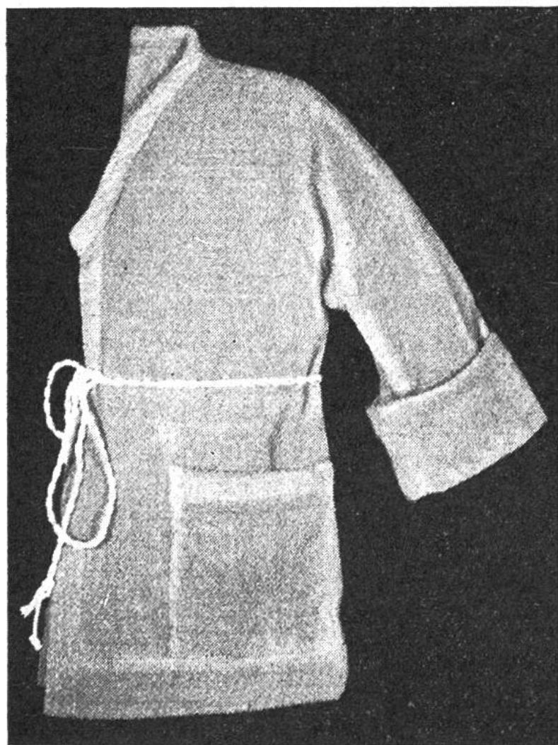
Bademantel mit Kimono-Ärmeln.

M., 25 \times 1 M. abkehren. Es bleiben 24 M., 1 cm hoch gerade stricken. Beim Erhöhen des Hinterteils 6 \times 7 M. abkehren.