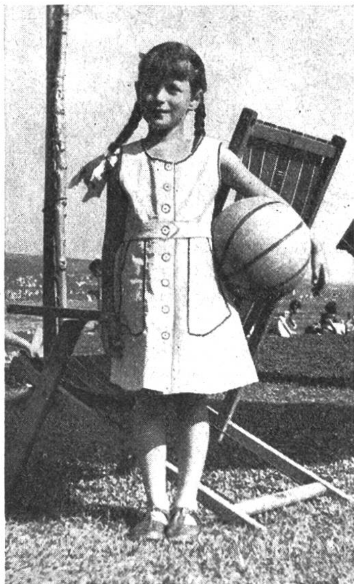
Das Trägerkleid lässt sich an warmen Tagen gut ohne Blüschen tragen.

Dieses Jahr bringen wir wieder nützliche Sachen, praktisch für euch und eure Geschwister und als Geschenke. Sicher werden alle von euch mit Freuden arbeiten und sich interessieren, wie ein Stück nach dem andern entsteht. – Wir wünschen gutes Gelingen zu der unterhaltenden und nützlichen Beschäftigung.