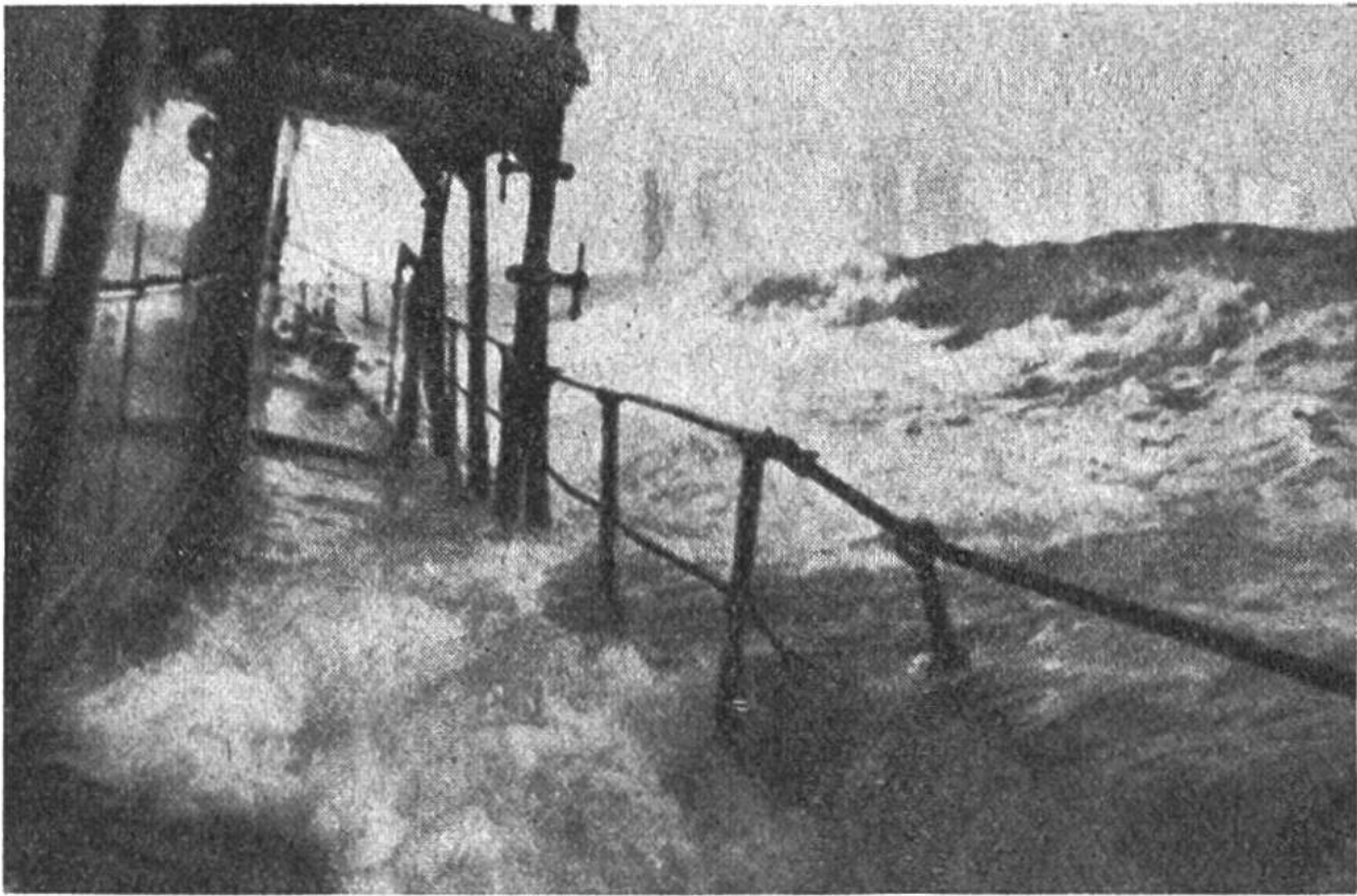
Zwei Gefahren: im Vordergrund das stürmische Meer, im Hintergrund der drohende Eisberg.

Luftwirbel befindet, welcher die gewaltigsten Wassermengen bis in Wolkenhöhe reisst.