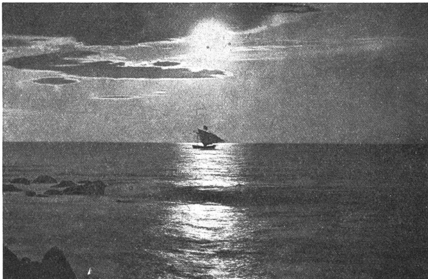
Sonne und Segel bei Meeresstille in den Gewässern Hinterindiens.

Verlagerung der Wärme- und Kältezentren dauernd in Bewegung befindet. So sinkt beispielsweise das kalte Wasser des Südpolarmeers in grösste Tiefen und strömt von dort immerfort den Meeren wärmerer Zonen zu; so wälzen sich auch, verursacht durch die Anziehungskraft des Mondes wie der Sonne, täglich zwei Flutwellen rings um die Erde. Fallen bei Neumond und Vollmond die Mondflut und die Sonnenflut zusammen, so entsteht eine Springflut, welche auf offenem Meer nur einen Meter Fluthöhe ausmacht, aber auf ihrem Weg von Ost nach West in den Buchten und Flussmündungen katastrophale Verheerungen anzurichten vermag. Da das Erscheinen solcher Springfluten berechnet und frühzeitig gemeldet werden kann, ist es Anwohnern von Küstengegenden ermöglicht, das seltsame Wandern der Springflutwellen flussaufwärts zu verfolgen.