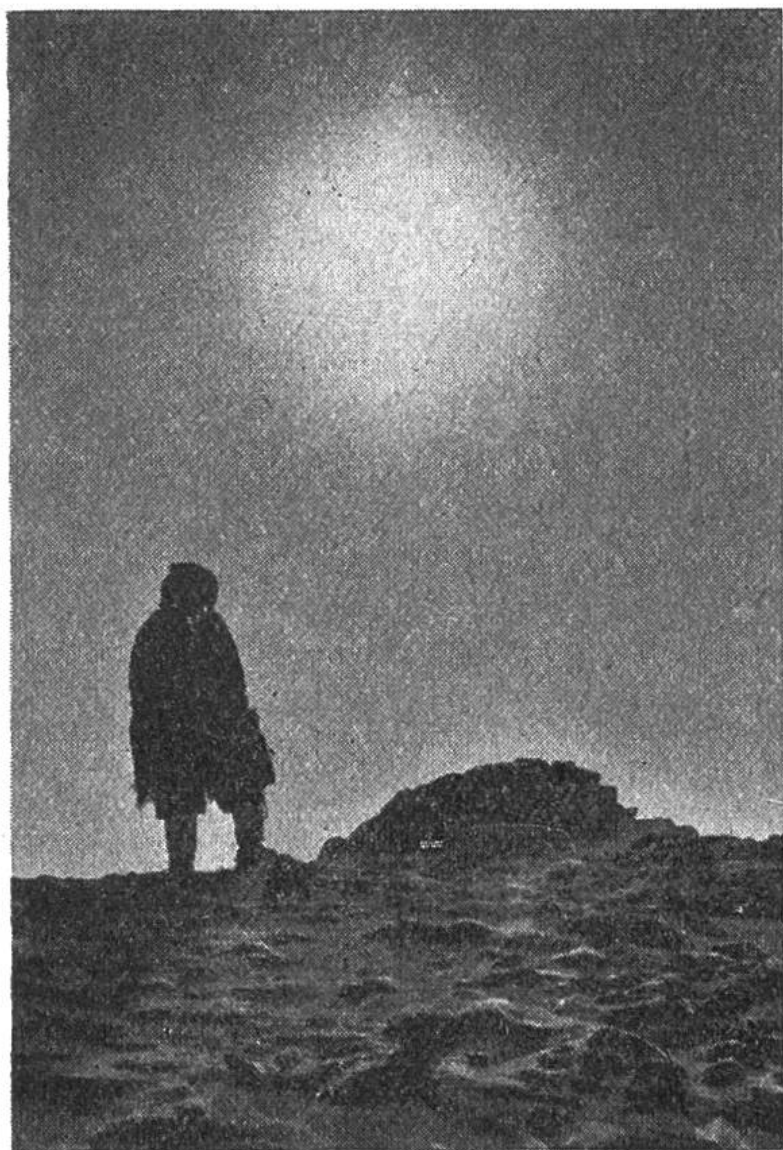
Eskimo vor einem einsamen Grab - einem Steinhaufen in der Tundra.

Tätigkeit der Königlich Kanadischen Polizei zu sein; denn die Rechtsvorstellungen der Eskimos sind anders als die kanadisch-europäischen, so dass die Eingeborenen manchmal für Handlungen bestraft werden, die sie nicht als Verbrechen ansehen. Dagegen sind die Bemühungen der Regierung im Gesundheitsdienst, zu welchem auch Flugzeuge eingesetzt werden, eine wahre Wohltat. Es ist zu hoffen, dass das kleine Volk der kanadischen Eskimos, das sein entbehrungsrei-