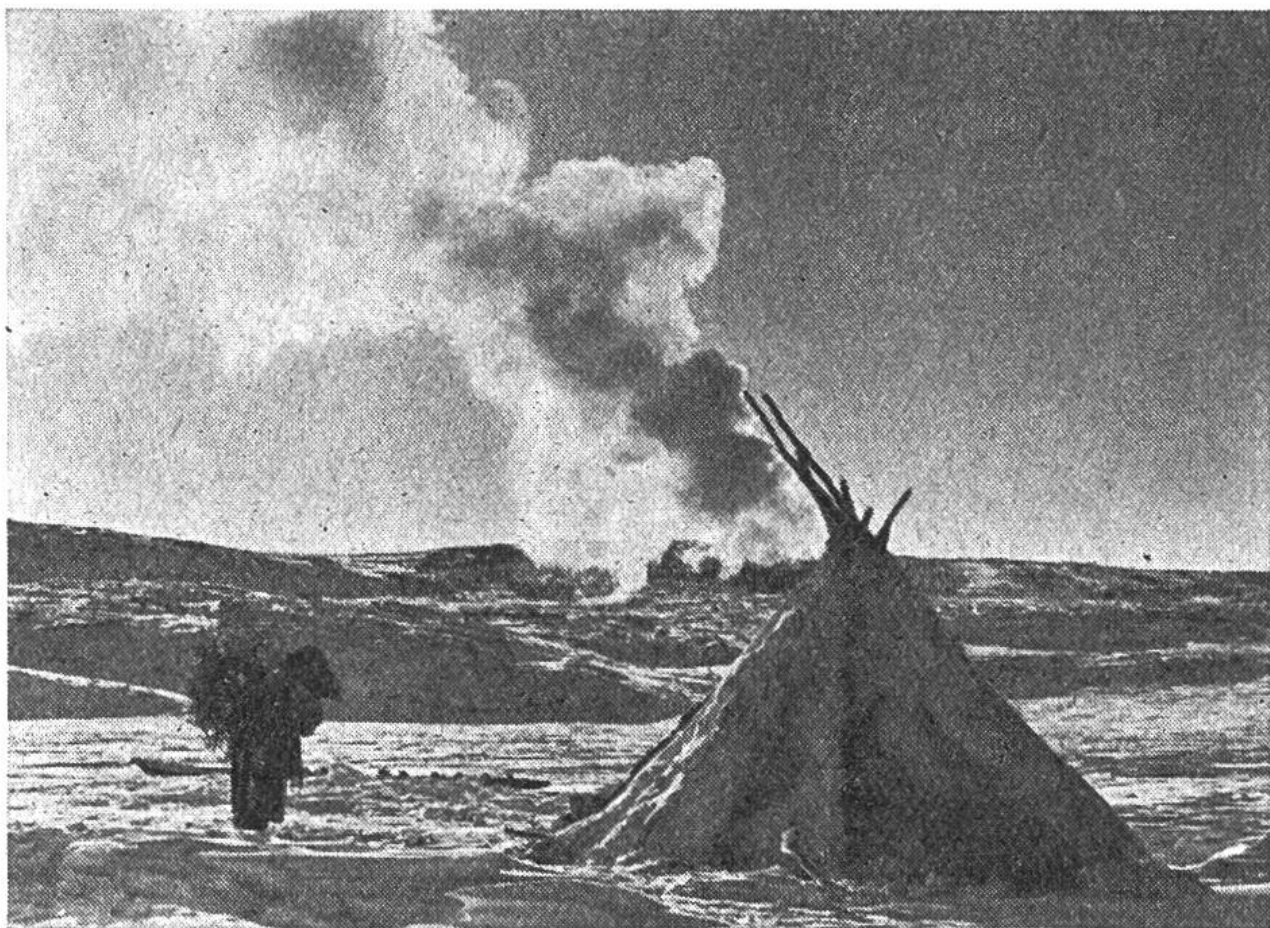
Zelt aus einem Stangengerüst und darübergelegten Rentierfellen. Davor eine Frau, die mit einem Bündel Reisig und Heidekraut zum Feuern zurückkehrt.