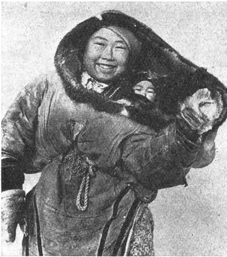
Junge Eskimo-Mutter mit ihrem Kind.

in rohem und gefrorenem, nur gelegentlich in angekochtem Zustand verzehrt. Anders verhält es sich in den Übergangszeiten und im Sommer: da unterhalten die kanadischen Eskimos kleine Feuer aus mühsam zusammengesuchtem Heidekraut und Reisig. Zu dieser Zeit leben sie in Zelten, die ursprünglich stets aus Rentierfellen bestanden, während heute auch sol-