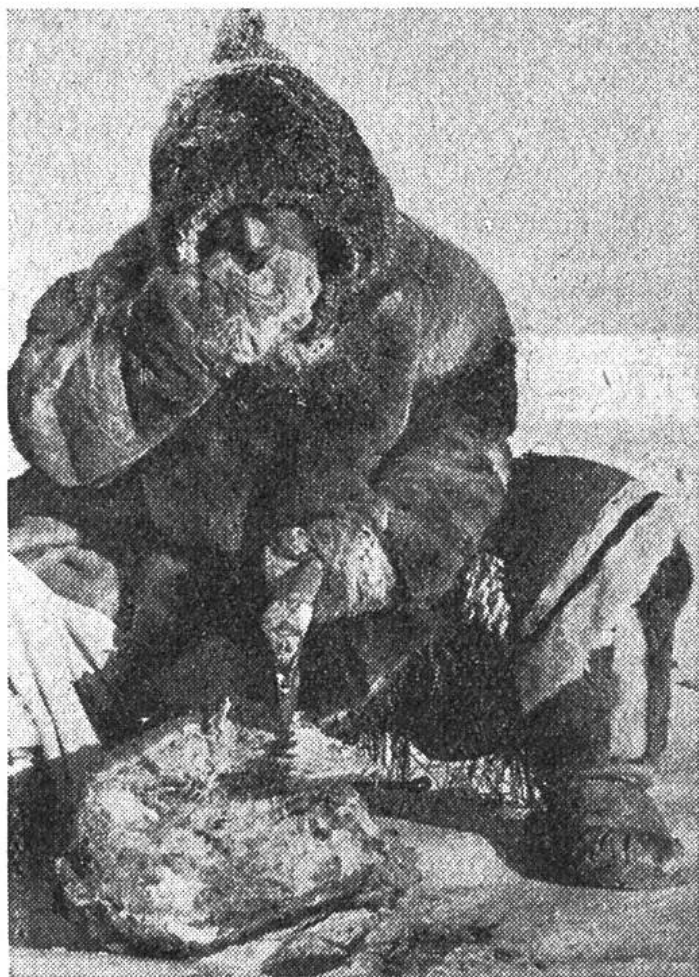
Im Winter wird die Nahrung – hier ein Stück gefrorenes Rentierfleisch – roh oder nur leicht angekocht verzehrt.

Eisbären und an der Küste auch die genannten Wassersäuger; Polarfüchse werden wegen ihres wertvollen Pelzes mit Hilfe von Fallen gefangen. Die Fischerei, die im Winter mit Netzen unter dem Eis der Seen und Flüsse betrieben wird, spielt ebenfalls eine wichtige Rolle. Die Jagd liefert den Eingeborenen nicht nur die lebensnotwendige Nahrung, sondern auch Knochen und Horn für die Herstellung mancherlei Geräte, ferner die für die Anfertigung von Kleidungsstücken