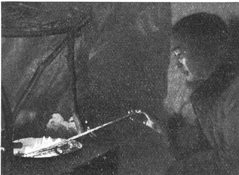
Die mit Rentierfett oder Tran gespiesene Lampe verbreitet Helligkeit, ohne jedoch spürbar zu wärmen.

che aus Stoff verwendet werden. Ein ähnlicher Wechsel lässt sich auch auf dem Gebiet der Jagdwaffen feststellen, indem der Bogen fast ganz durch das Gewehr verdrängt worden ist. Geschossen werden in erster Linie Rentiere, ferner