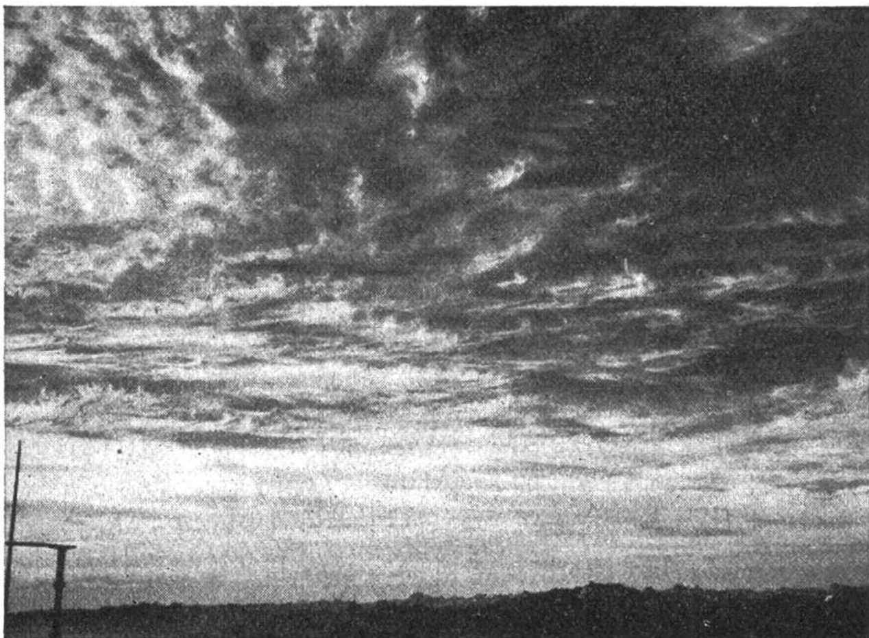
Federwolke (Cirrus). Feine silberglänzende Fäden, welche an einzelnen Stellen krallen- oder büschelförmig sind.

welche rasch in die Höhe wächst (Bild 1). Der überschüssige Wasserdampf wird beim Aufsteigen in Form einer Haufenwolke (Cumulus) ausgeschieden. Wenn dieser Wolkenberg ungehindert weiterwächst, gelangt er bald in Höhen von 6000 bis 10 000 m, wo die Temperatur so tief ist (unter -20^{\circ}\text{C} ), dass die Wassertröpfchen sich in Eiskristalle verwandeln und die Wolke sich oben pilzförmig ausweitert, ein Zeichen, dass sie sich zur Gewitterwolke umgewandelt hat und wir uns auf ein Unwetter gefaßt machen müssen.