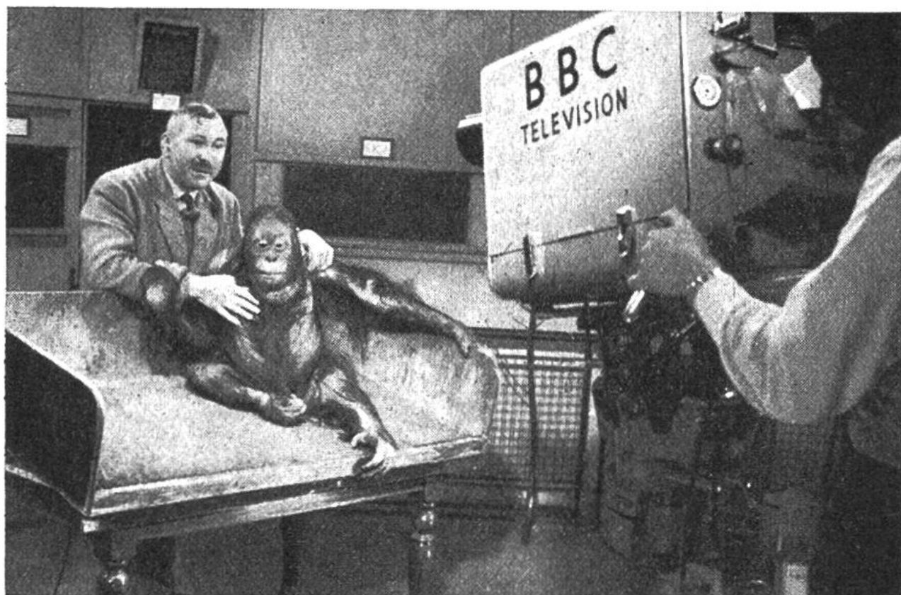
Orang-Utan vor der Televisions-Kamera im Londoner Zoo.

haft in die Wohnungen von Tierfreunden zu zaubern. Einstweilen verhält es sich bei uns so, dass dafür geeignete Tiere zur Aufnahme nach dem Televisionsstudio gebracht werden müssen, was zuweilen mit gewissen Schwierigkeiten verbunden ist. Nicht allen Tieren kann eine solche Ortsveränderung zugemutet werden. Im Londoner Zoo und in vielen amerikanischen Tiergärten, wo Televisionssendungen zu den regelmässigen Erscheinungen gehören, kann man den Tieren diese Unannehmlichkeit ersparen: die Kamera – oder besser die Kameras – kommen zu ihnen. Es wird nämlich in der Regel gleichzeitig mit drei Kameras aufgenommen. Der Regisseur, in dessen transportablem Studio gleichzeitig alle drei Bilder erscheinen, schaltet eine der drei Aufnahmen zur Sendung um. Auf diese Weise entsteht ein höchst lebendiger Bildbericht, der auch dann nie langweilig ist, wenn etwa ein Tier wegen des grellen Lichtes oder aus anderen Gründen sich nicht in der gewünschten Weise bewegt. Es kann ja immer aus drei Aufnahmen die beste und interessanteste zur Sendung verwendet werden. H.