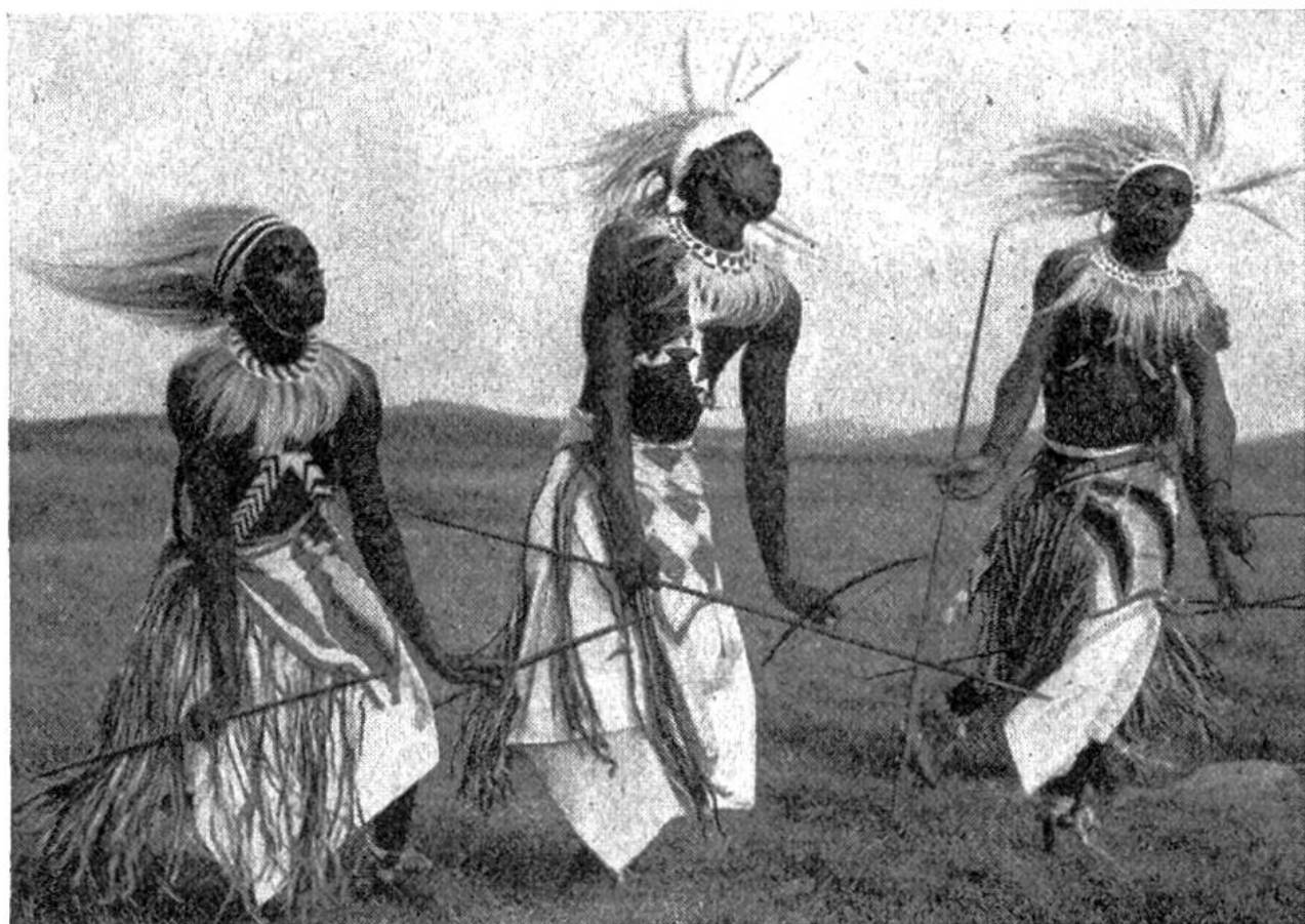
Drei der Pagen des Königs von Ruanda während einer der traditionellen Tänze, die jahrelange angestrenzte Übung erfordern.

selten brutal. Sie drangen vor ungefähr fünfhundert Jahren, aus dem Kongo kommend, in Ruanda-Urundi ein und verdrängten die dortige Urbevölkerung, die Batwa, die heute nur noch 1% der Bevölkerung ausmachen. Die Batwa sind hässlich, untersetzt, doch sind sie tapfer, verstehen sich zu wehren und lieben die Unabhängigkeit. Sie sind Jäger, werden aber auch an den Königshof gezogen, wo sie als Tänzer oder Wächter eingesetzt werden. Als Tänzer? Solch hässliche Menschen? Wir werden später vernehmen, weshalb.