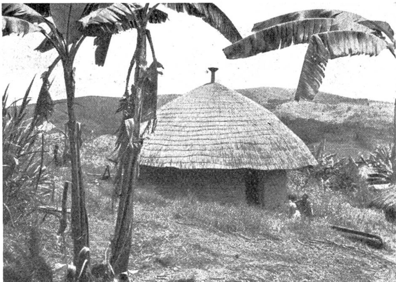
Eine aus Lehmziegeln erbaute strohbedeckte Eingeborenen-Rundhütte auf der hügeligen Hochebene von Urundi. Im Vordergrund Bananenpflanzen.

wilden, primitiven, ja fast diabolischen Tanzart hingeben. Ein Band aus Perlen hält eine Art Mähnenbusch aus weissen Reiherfedern, die über Rücken und Schultern fallen, aus dem Gesicht. Der Tanz ist packend. Eine Schlacht wird getanzt. Hohe Sprünge wechseln mit wirbelnden Bewegungen am selben Platz, die Watutsi verhalten und vertieft, die Batwa mit wilder Freude am Rhythmus. Und dieses Wilde, Primitive, Erdhafte unterstreicht in geschickter Weise die hochstehende, edle Tanzart der Pagen. Die Batwa bilden somit wunderliche Schatten, um das Licht der Herrenmenschen noch leuchtender zur Geltung zu bringen. Eine Musik, die sich innerhalb von 10 Noten bewegt, begleitet den aufregenden Tanz.