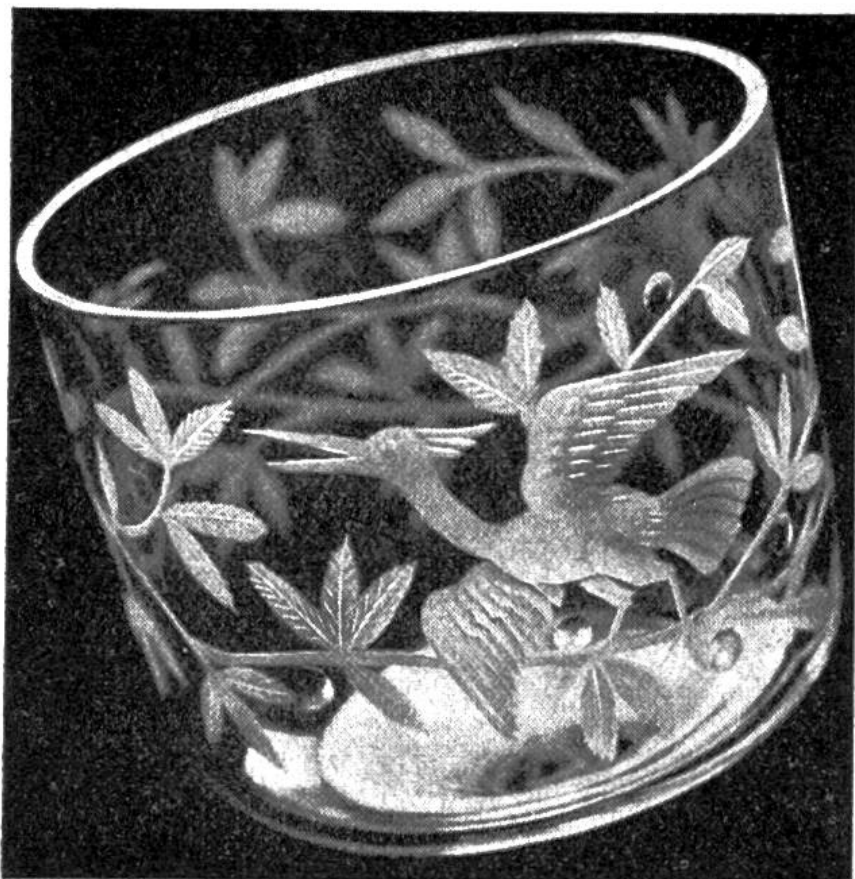
Schale mit Vögeln und Zweigen, 1938 gezeichnet und geschliffen von Jakob Werner.

ken, in Stadt und Land bei uns wieder auf und damit auch die edle Kunst des Glasschleifens. J. A.