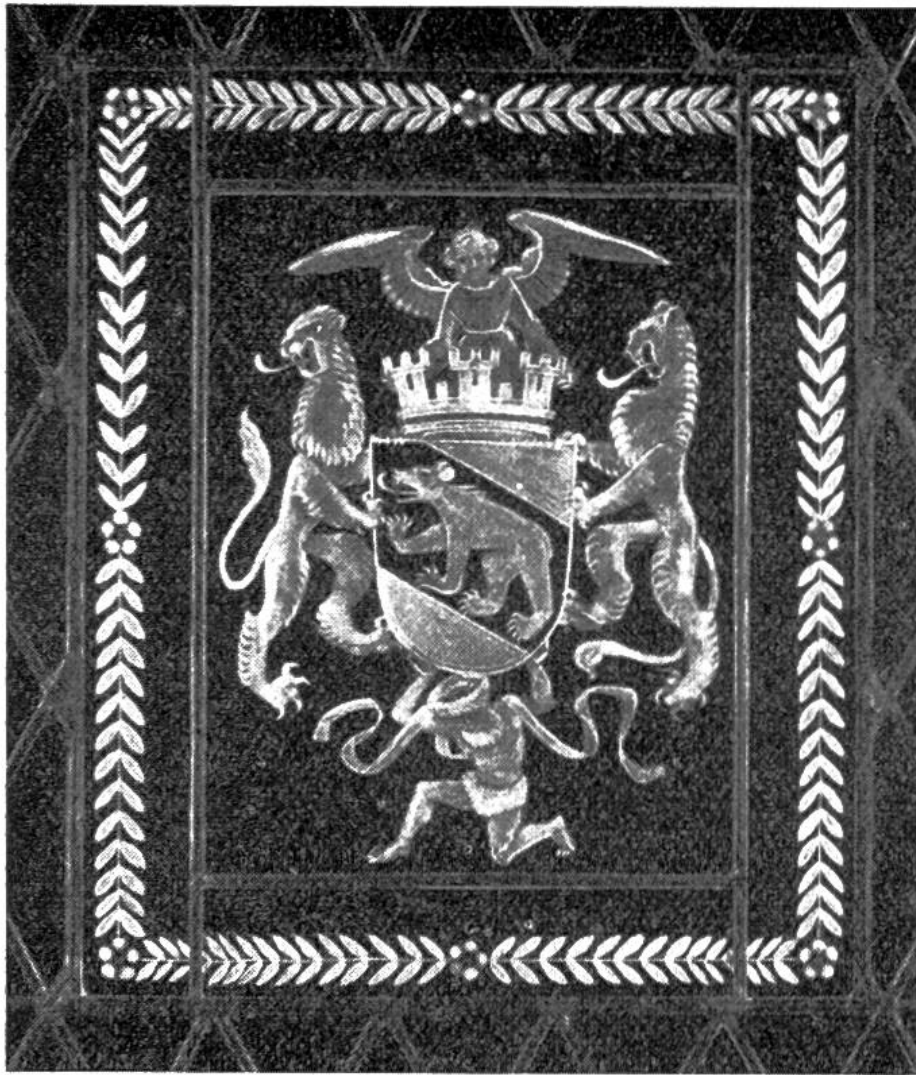
Mittelstück der Wappenscheibe, welche die Stadt Bern 1951 Zü- rich schenkte. (Gezeichnet von Paul Boesch, Bern, geschlif- fen von Jakob Werner, Frau- enkappelen.)

der Schweiz und im Auslande herrschte: Wenn jemand ein Haus baute, schenkten ihm seine Freunde geschnitzte Türbalken und Laubenstützen oder auch Fenster mit eingelassenen Bildscheiben. Vom 15. bis ins 17. Jahrhundert wurden meist Scheiben geschenkt, die aus farbigem Glase zusammengesetzt waren. Danach kamen die farblosen Scheiben mit eingeschliffenem Bild auf. Doch war es nicht nur bei Neubauten, sondern auch bei Hochzeiten, Taufen, sowie beim Antritt und Verlassen eines Amtes und noch bei andern Gelegenheiten üblich, geschliffene Scheiben, Gläser oder Flaschen zu schenken. Auf den Scheiben wurden unter dem Bilde meist die Namen der Schenkenden (nicht der Beschenkten) eingraviert. So konnte ein Bauherr manchmal in den Fenstern seiner neuen Wohnung die Namen aller seiner Freunde lesen, die ihm auf diese Weise täglich gegenwärtig waren. Heute lebt der schöne Brauch, geschliffene Gläser, Flaschen und Scheiben zu schen-