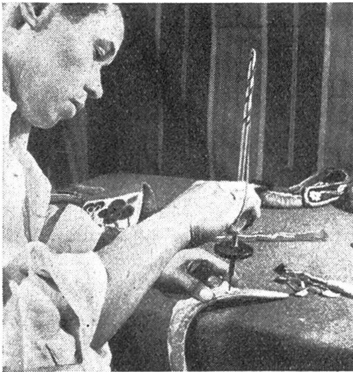
Der Vollblutindianer arbeitet mit dem schon voreinst verwendeten Werkzeug an Bogen und Geweih.

geschichtlichen Museum von New York beschäftigt wird, so widmet er doch all sein Wissen und seine Kunstfertigkeit der bildnerischen Erhaltung von indianischen Überlieferungen, von Jagdszenen, Kostümen, Schmuck und Ornamenten. Auf ihn warten die Knaben in den Parkanlagen, bis er sich in seiner Freizeit zu ihnen gesellt, von Sitten und Wesen der echten Indianer erzählt, den Nach-eifernden Anleitungen gibt und ihnen bei der sachgerechten Einkleidung hilft. Noch wichtiger aber sind ihm die Vortragsreisen, die er zu Universitäten, Schulen und Pfadfinderlagern unternimmt, wo er mit stammesüblichem Tanz und eindringlicher Rede das Brauchtum der noch lebenden Indianer veranschaulicht. Denn ihm liegt wie seinen jungen Freunden in der Großstadt vor allem daran, dass sich die Rassen und Völker in ihrer Eigenart gegenseitig kennenlernen und da-