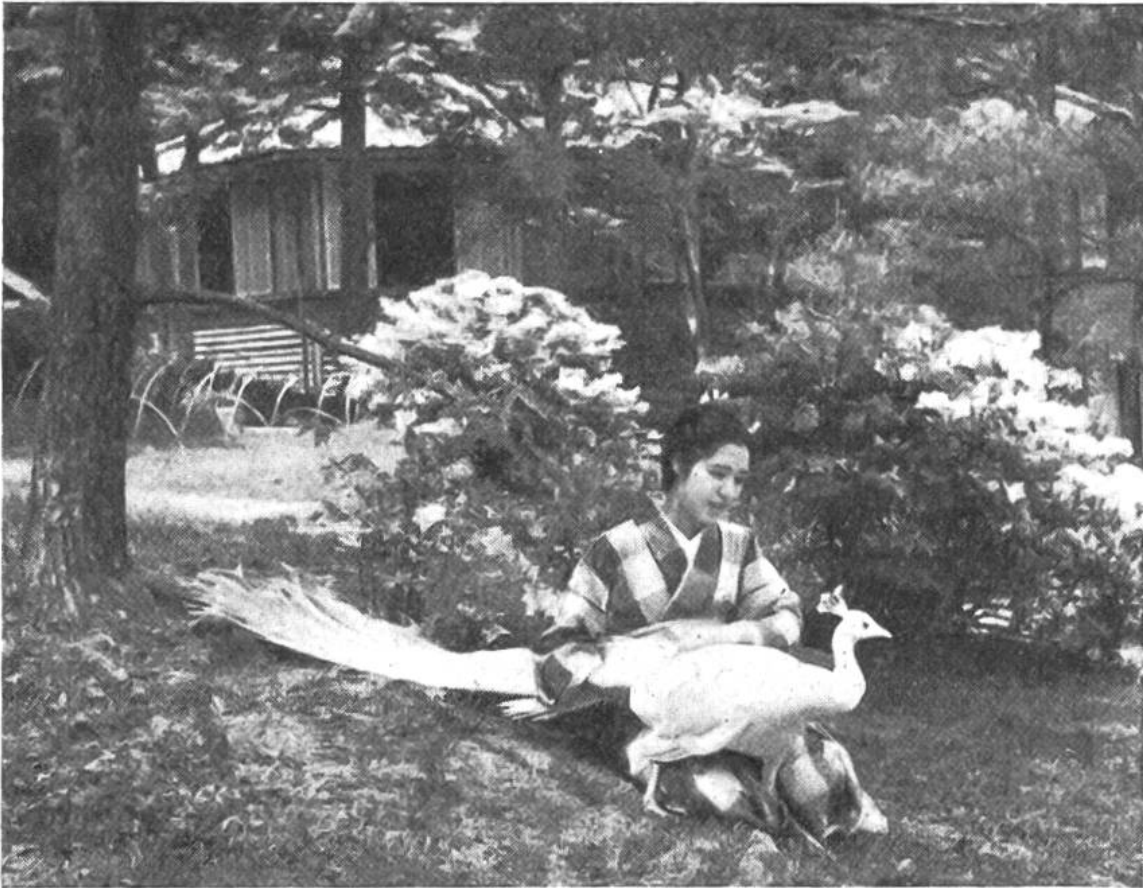
Die Tochter im Garten mit einem weissen Pfau. Im Hintergrund blühende Azaleen.

ist alles. Die feinen Bodenmatten und die Sitzkissen, auf denen jede Tätigkeit des häuslichen Lebens verrichtet wird, ersetzen das Mobiliar.