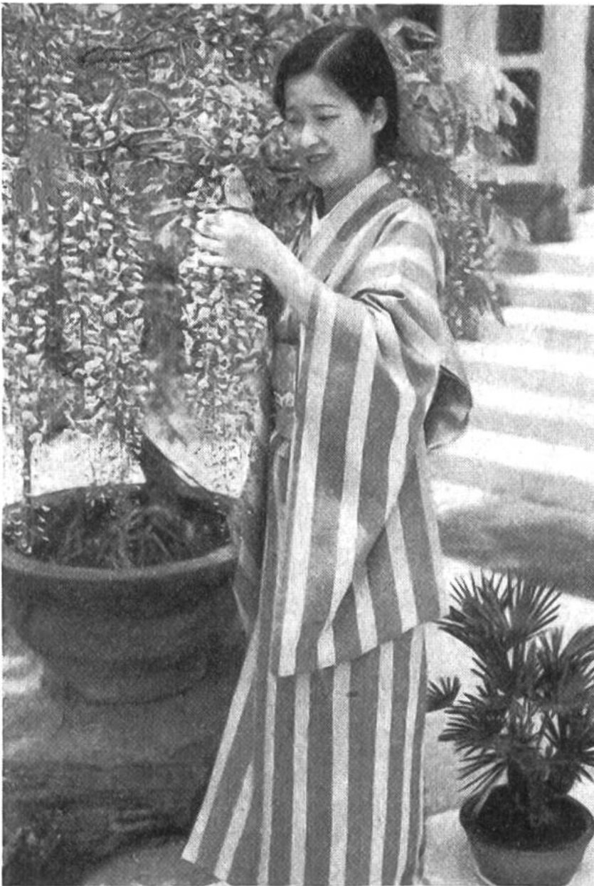
Die Haustochter mit einem Sperling aus Java unter einer blühenden Glyziniestaude.

Matte, die der Mattenflechter seit Menschengedenken nur im Format 90 \times 180 cm flicht. Es ist die Fläche, die ein liegender Mensch beansprucht. Die Massverhältnisse der Matte beherrschen das ganze Haus von der Breite und Höhe der Türen und Fenster bis zum Giebel. In Japan gibt ein begüterter Bauherr etwa ein Wohnhaus mit vier Sechsmattenzimmern in Bau. Das japanische Haus enthält fast keine Möbel, keinen Stuhl, kein Bett. Darin liegt sein besonderer Reiz. Gegenstände, die dem täglichen Leben dienen, sind in ebenfalls genormten Wandschränken untergebracht. Aber es ist nicht der Rede wert, was der Japaner braucht: Kissen zum Sitzen und Schlafen, Decken und Matratzen, einen niedrigen Speisetisch – das