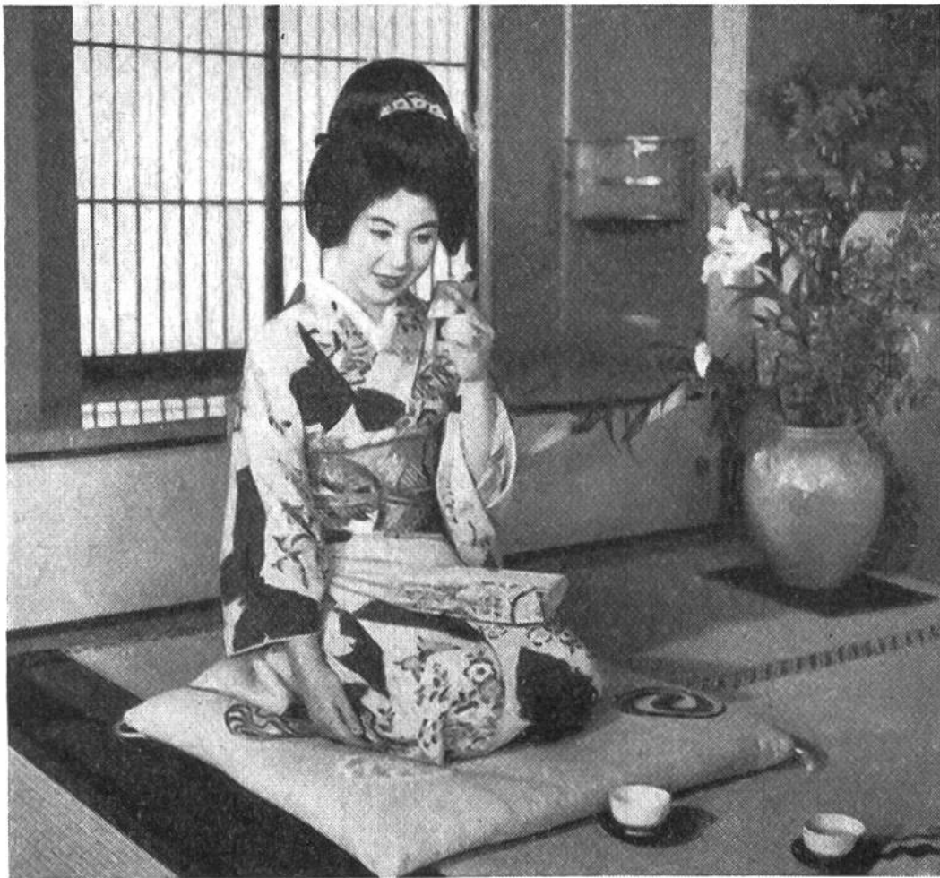
Eine Japanerin im blumengeschmückten Alkoven ihres Hauses.