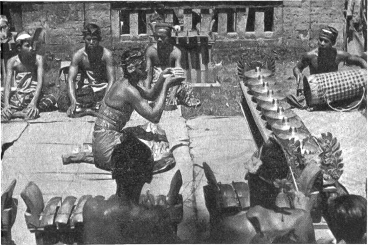
Orchester und Tänzer in Süd-Bali.