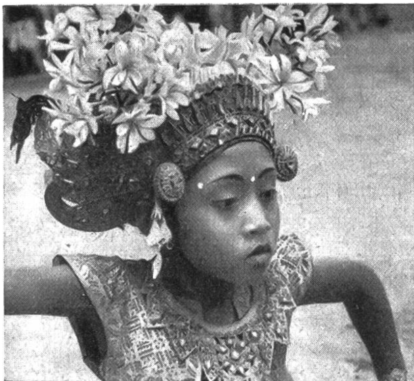
Legong-Tänzerin mit Krone aus vergoldetem Leder, Gold- u. Silberblech u. duftenden Blüten des Kambodscha-Baumes. Süd-Bali.

Vortänzer. Die Vorführung besteht zur Hauptsache aus genau einstudierten Bewegungen von Kopf, Armen und Oberkörper. Dazu wird gesungen und ausserdem spielt ein kleines Orchester. Nicht selten endet der Djanger mit humoristischen Darbietungen, beispielsweise mit Pyramiden der Knaben, die von den Zuschauern mit fröhlichem Beifall belohnt werden.