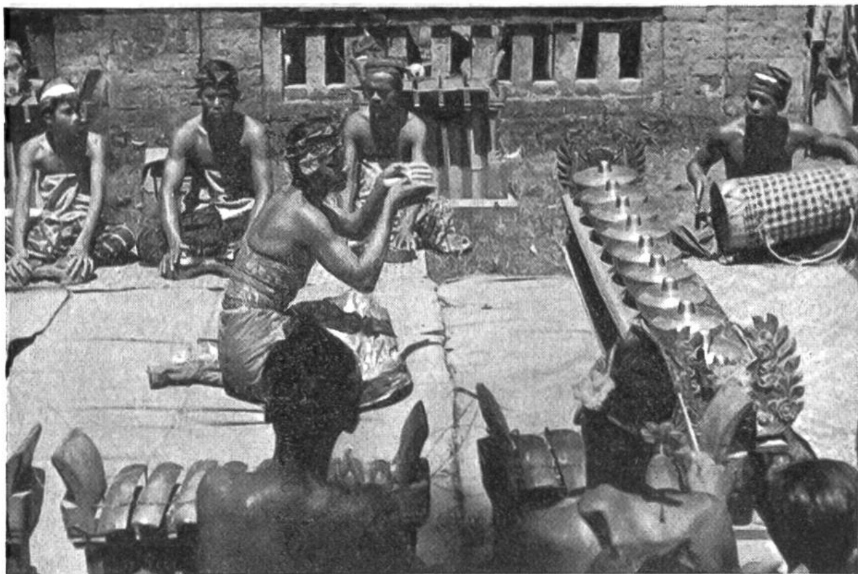
Orchester und Tänzer in Süd-Bali.