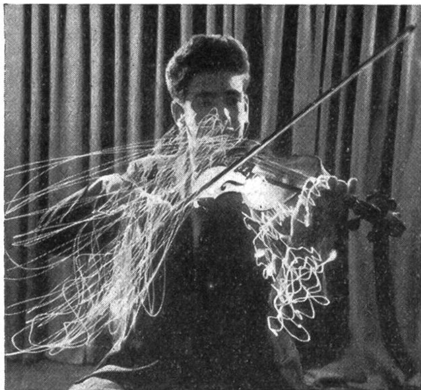
Der Geiger führt den Bogen in fließenden Kurven. Die Finger der linken Hand greifen in die Saiten.

mus, Tonstärke und Modulierung an und formt aus den vielen geigenden, blasenden, trommelnden, flötenden Musikern eine harmonische Gemeinschaft, die wie ein einziges atmen-des Wesen sich dem Leben der Musik hingibt. Den Händen des Dirigenten wohnt gleichsam eine Zauberkraft inne, die imstande ist, die stummen Noten der Partitur zu klingendem Leben zu erwecken. Seine Hände geben auf Befehl seines Geistes der Freude, der Trauer, dem Jauchzen und der Klage – allen Gefühlen, Gedanken, Empfindungen und Stimmungen – Ausdruck und Laut, die der Komponist in das Musikstück hineingelegt hat.