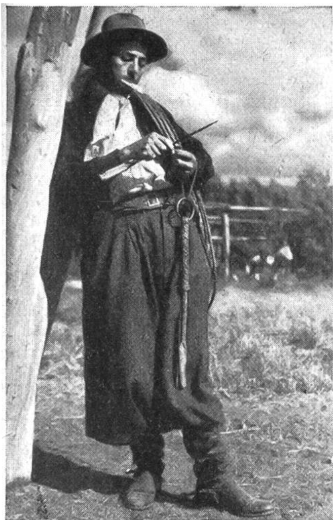
Ein Gaucho dreht sich eine Zigarette. Erschneidet den Tabak in feinen Scheiben von einem Tabakstrick; denn in der Form von langen, gedrehten Stricken wird hierzulande der Tabak verkauft.