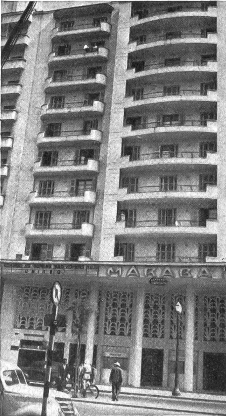
Das Hotel Maraba in Sao Paulo. Es gibt kaum ein moderneres Hotel auf der Welt.

einst als Sklaven aus Afrika zur Goldgewinnung und als Arbeiter für die grossräumigen Pflanzungen hergeschafft wurden, fristen ein primitives Dasein. Sie werden sich aber – dafür sprechen viele Anzeichen – mit der Zeit wie die Indianer der vorherrschenden, weissen Rasse angleichen, die gerade in Brasilien vorurteilslos genug ist, farbige Völker in sich aufzunehmen. Aus dieser Aufsaugung und Angleichung ist bereits der eigenartige brasilianische Volkstypus portugiesischer Umgangssprache entstanden, der schon heute als Mischling nicht mehr auffällt. – Mehr als die Hälfte der Kaffee-Erzeugung