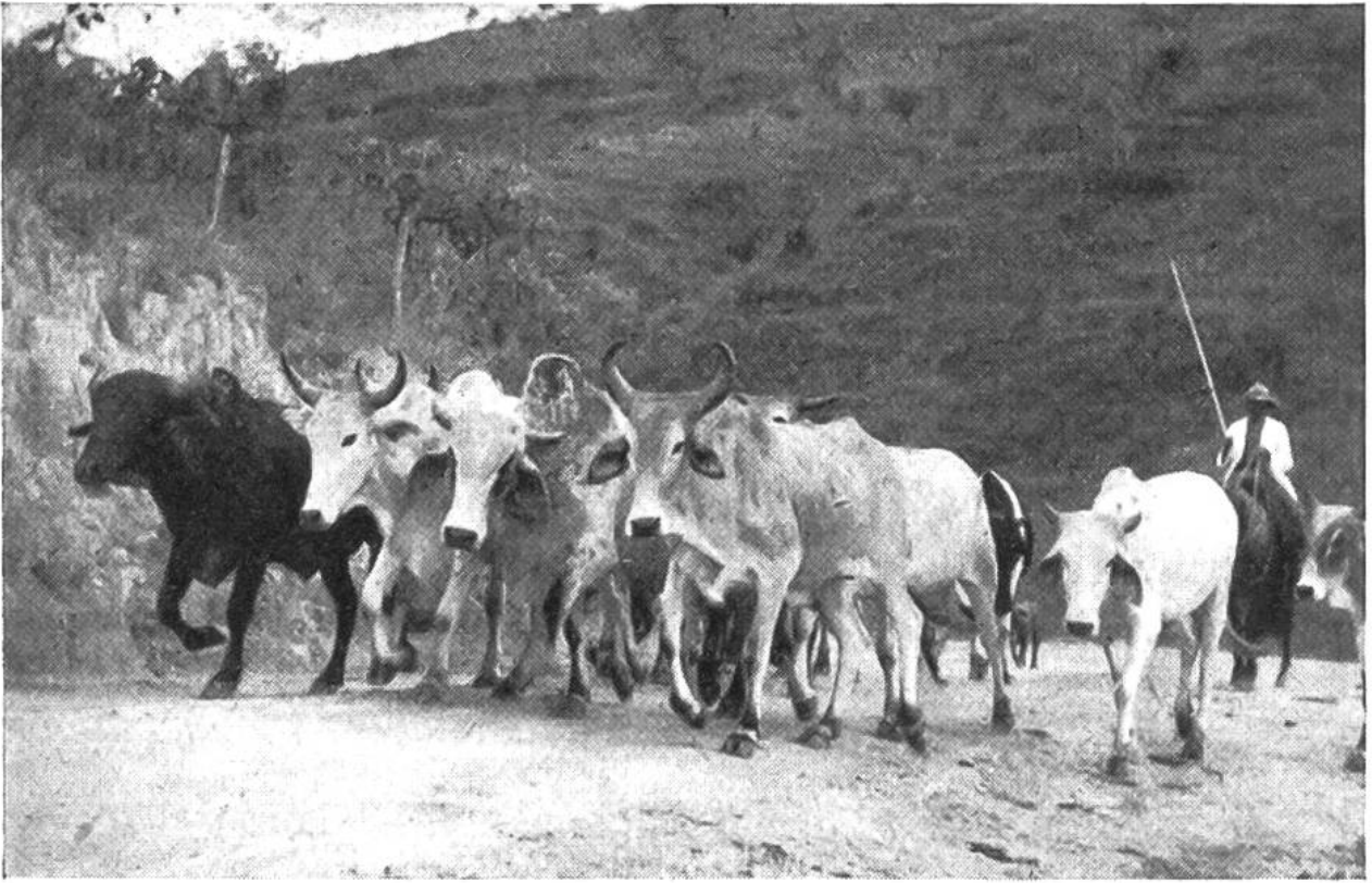
Im Innern Brasiliens. Ein Gaucho treibt seine Zebuherde auf die Weide.

Zuckerrohr oder Baumwolle und wieder andere von Bananen und Orangen. Diese gewaltigen Grundstücke (Areale) gehören jeweils einem einzigen Besitzer, meist einem Nachkommen der portugiesischen Eroberer, der mit einem Heer von Indianern, Negern oder Mischlingen die Felder bebaut und die Ernten einbringt.