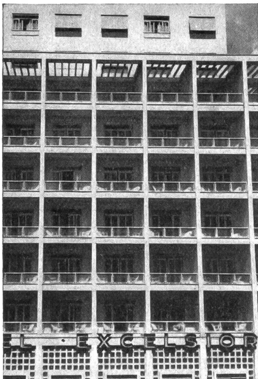
Ein Hotel neuester Baukonstruktion in Sao Paulo. Im gleichen Gebäude befindet sich ein Kino.

hochgewachsenen, modernsten Millionenstadt Sao Paulo; welcher Fleiss und Überfluss in den Handelsstädten Bahía, Santos, Porto Alegre, die meist an günstigen Hafenbuchten der Küste liegen! — Und im Innern des überaus locker und dünn besiedelten Landes ... welch schroffer Wechsel ins Tief der menschlichen Lebensverhältnisse! Die schon zur Zeit der Eroberung durch die Portugiesen zahlenmässig schwache indianische Urbevölkerung (heute etwa 1,6 Millionen) steht auf kulturell niedrigster Stufe. Sie lebt in den Rändern der Urwälder und kommt zum Jagen und Fischen in die tropischen Grassteppen, die Savannen, und an die Ufer der grossen Ströme heraus. Die vier Millionen Neger, deren Vorfahren