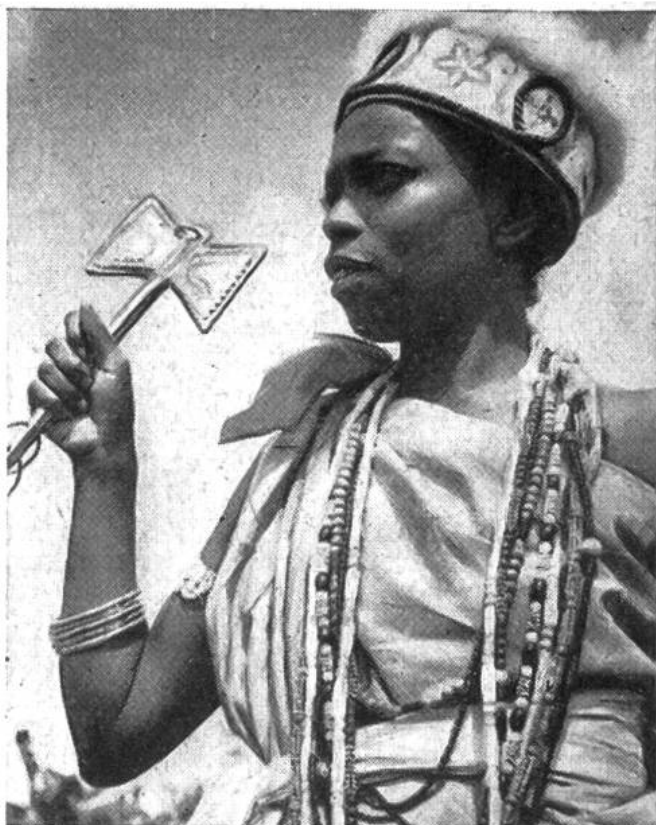
Die Tochter des Geistes – eine Art indianischer Priesterin im Feiergewande. Sie ist für ihr ganzes Leben der Gottheit geweiht, die in rauschartiger Besessenheit von ihr Besitz genommen hat und sich den Mitfeiernden im Fetischtanz offenbart. Dieser entwickelt sich aus einem traumhaften Zustand und führt bis zu der heftigsten Verzückung.

(Sao Paulo) industrielle Betriebe und Fabriken entstanden, welche die Produkte des Landes verarbeiten. Die Textil- und Nahrungsmittelfabrikation wie auch die Lederverarbeitung bringen neue Reichtümer ins Land, die den grossen sozialen Unterschied der Klassen, die Kluft zwischen Reichen und Armen, noch vertiefen.