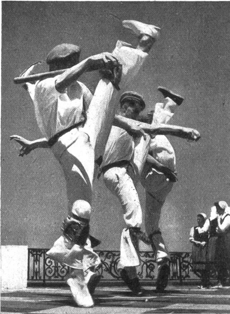
Diese wilde Ver- zückung heisst „Makil“ und ist nur d. Männern vorbehalten.

und Sinn heute längst nicht mehr vom Volk verstanden wird, lebt auch in den Tänzen der Basken an den Festen des Jahres wieder hell auf. Was einst ein religiöser Vorgang, Tanz zur Austreibung von Dämonen, zur Verehrung der Gottheiten und der Ahnenseelen war, das hat im Lauf der Jahrtausende den religiösen Sinn verloren und sich zum weltlichen Tanz bei Fest und Feier gewandelt. So bewundern wir bei den alljährlichen Festen der Basken Bogen-, Bänder- und Schwerttänze, die in ihren wilden Sprüngen, eindrucksvollen Figuren und Verzückungen noch vieles vom religiösen Ernst ihrer frühzeitlichen Übung bewahrt haben. Gewisse Tänze sind wie bei den Primitiven nur den Männern vorbehalten. Beim „Zamalzin“, einem alten Zauber- und Dämonentanz, wird der Böse Geist