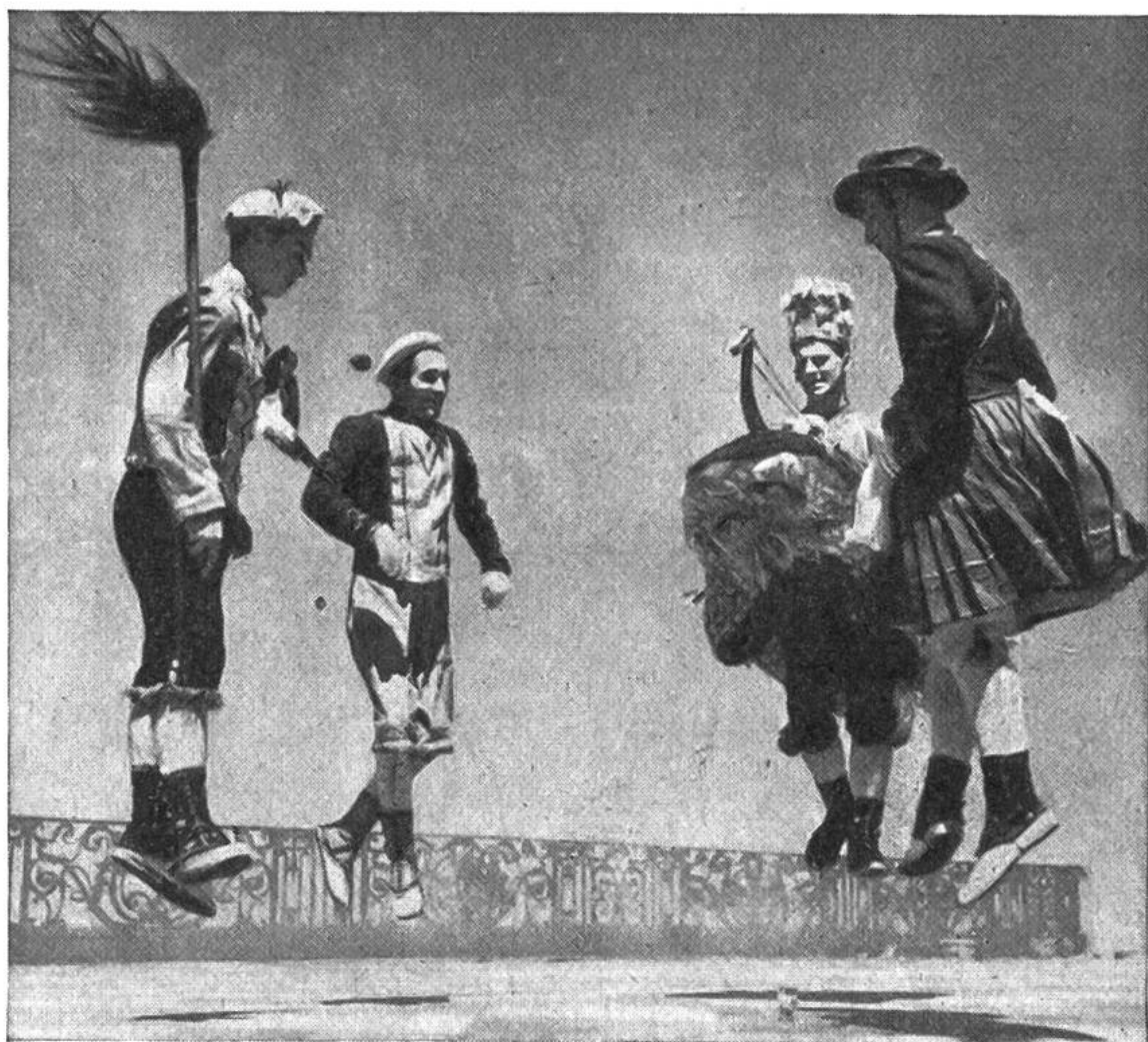
Der „Zamalzsín“, ein Dämonentanz der Basken. Zu diesem Tanz gehören der Böse Geist, der Verhexte, der Reitersmann und die Marketenderin.