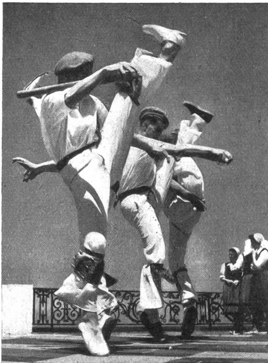
Diese wilde Ver- zückung heisst „Makil“ und ist nur d. Männern vorbehalten.

und Sinn heute längst nicht mehr vom Volk verstanden wird, lebt auch in den Tänzen der Basken an den Festen des Jahres wieder hell auf. Was einst ein religiöser Vorgang, Tanz zur Austreibung von Dämonen, zur Verehrung der Gottheiten und der Ahnenseelen war, das hat im Lauf der Jahrtausende den religiösen Sinn verloren und sich zum weltlichen Tanz bei Fest und Feier gewandelt. So bewundern wir bei den alljährlichen Festen der Basken Bogen-, Bänder- und Schwerttänze, die in ihren wilden Sprüngen, eindrucksvollen Figuren und Verzückungen noch vieles vom religiösen Ernst ihrer frühzeitlichen Übung bewahrt haben. Gewisse Tänze sind wie bei den Primitiven nur den Männern vorbehalten. Beim „Zamalzsín“, einem alten Zauber- und Dämonentanz, wird der Böse Geist