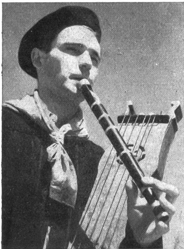
Zum Tanz spielen die Basken mit Blas- und Saiteninstrumenten auf. Der Musikant bedient beide zur gleichen Zeit.

tenen Rest der vorlateinischen Sprachenwelt Latein-Europas dar, die im übrigen völlig untergegangen ist.