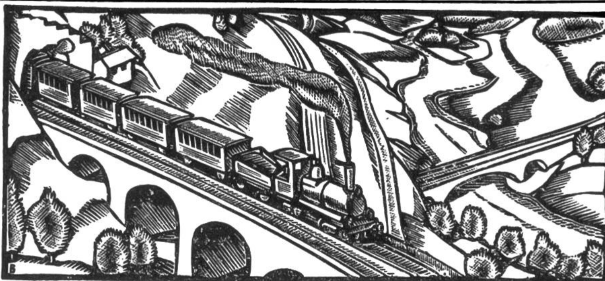
Die 1882 eröffnete Gotthardbahn hat 80 Tunnel und Galerien von zusammen über 46 km Länge und 1234 Brücken und Durchlässe. Sie fährt seit 1920 elektrisch.