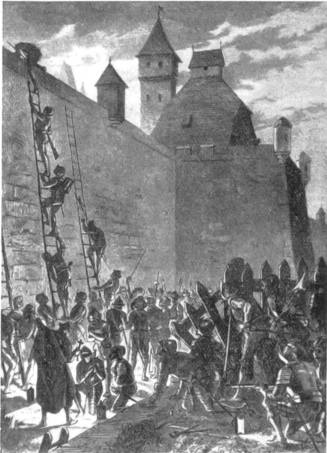
Die Escalade von Genf. Alljährlich am 12. Dezember feiern die Genfer das Ereignis der Escalade (= Ersteigung mit Sturmleitern) als die „wunderbare Errettung“ ihrer Stadt. Vor 350 Jahren, in der Nacht vom 11. auf den 12. Dezember 1602, versuchten Truppen des Herzogs Karl Emanuel I. von Savoyen die Stadt überraschend zu stürmen. Etwa 300 Mann erkletterten auf Leitern die Mauern und drangen in die Befestigungen ein. Doch die Genfer überwältigten die Angreifer in erbittertem Kampf. Der Sieg verhalf Genf zur Selbständigkeit (1603).