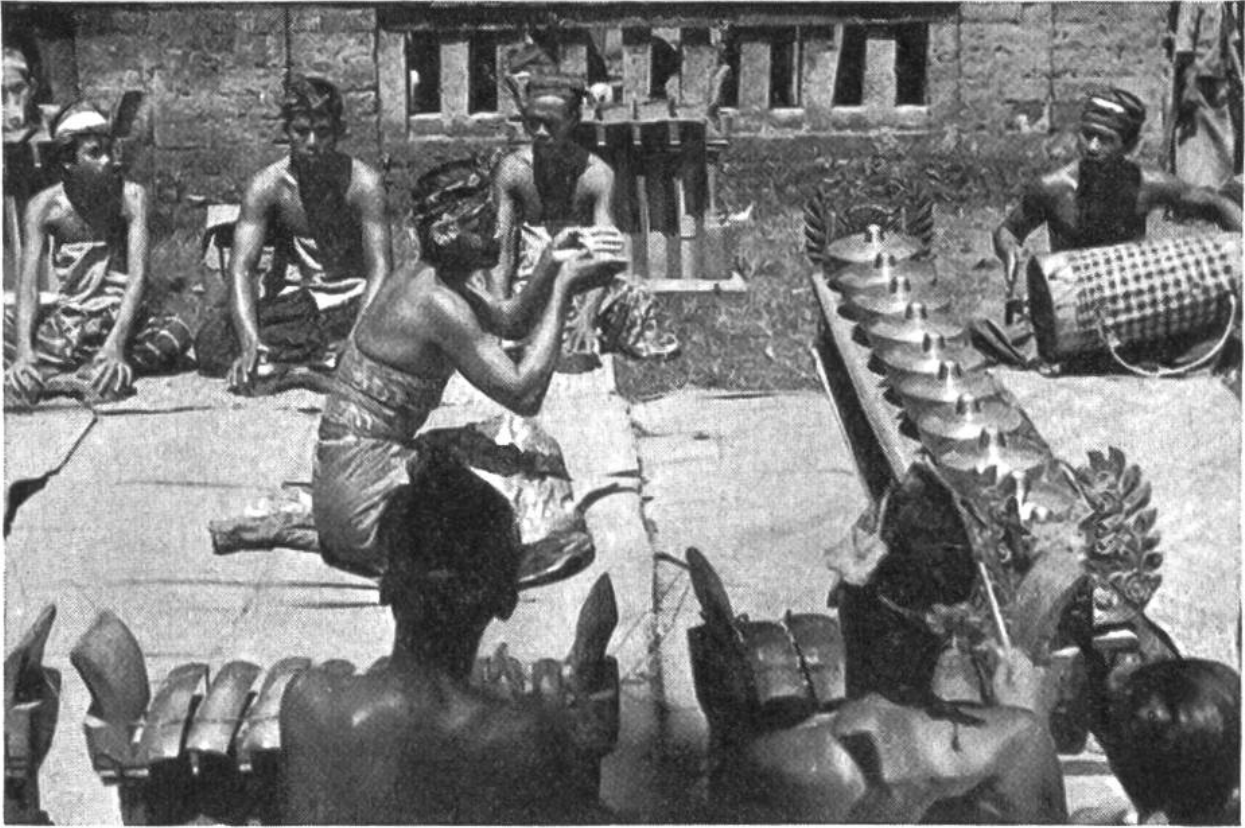
Orchester und Tänzer in Süd-Bali.