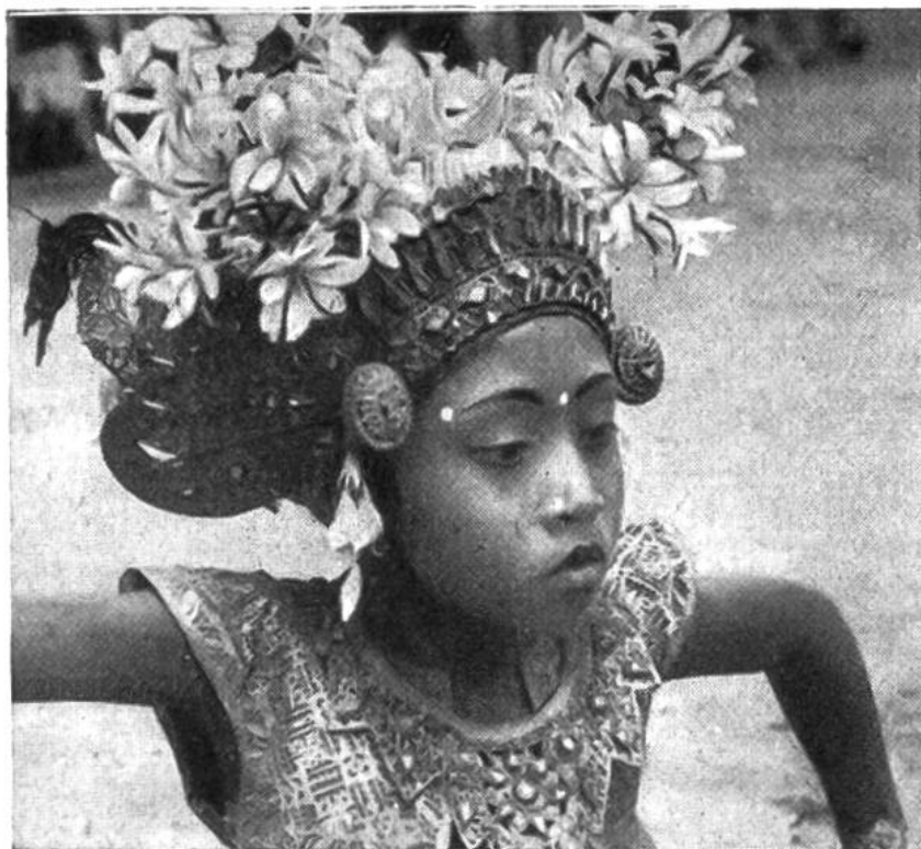
Legong-Tänze- rin mit Krone aus vergoldetem Leder, Gold- u. Silberblech u. duftenden Blüten des Kambodscha- Baumes. Süd-Bali.

Vortänzer. Die Vorführung besteht zur Hauptsache aus genau einstudierten Bewegungen von Kopf, Armen und Oberkörper. Dazu wird gesungen und ausserdem spielt ein kleines Orchester. Nicht selten endet der Djanger mit humoristischen Darbietungen, beispielsweise mit Pyramiden der Knaben, die von den Zuschauern mit fröhlichem Beifall belohnt werden.