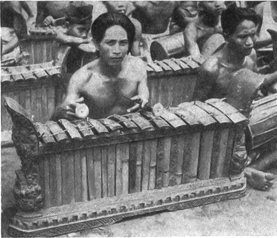
Teil eines Orchesters. Süd-Bali.

jeder von ihnen ist ein Künstler. Aufreizend und oft voll Wildheit sind aber auch die Tänze, in denen nicht selten maskierte Leute auftreten.