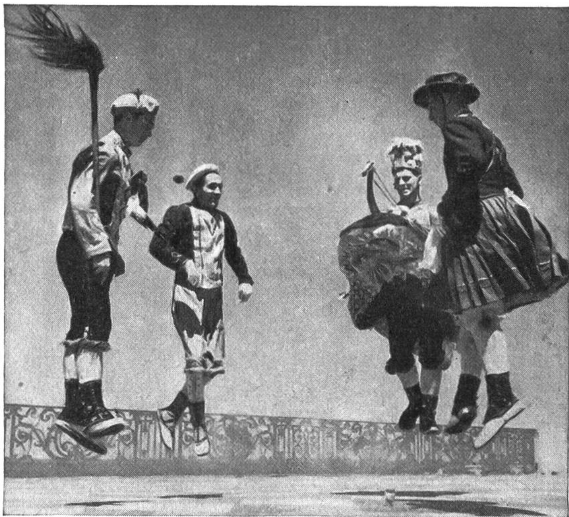
Der „Zamalzsín“, ein Dämonentanz der Basken. Zu diesem Tanz gehören der Böse Geist, der Verhexte, der Reitersmann und die Marketenderin.