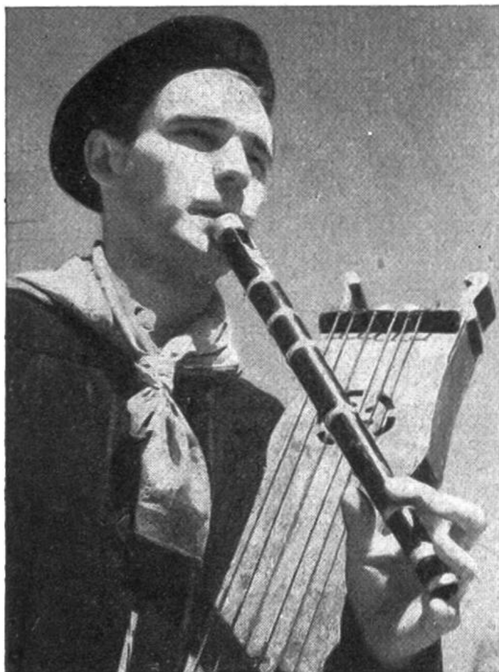
Zum Tanz spielen die Basken mit Blas- und Saiteninstrumenten auf. Der Musikant bedient beide zur gleichen Zeit.

tenen Rest der vorlateinischen Sprachenwelt Latein-Europas dar, die im übrigen völlig untergegangen ist.