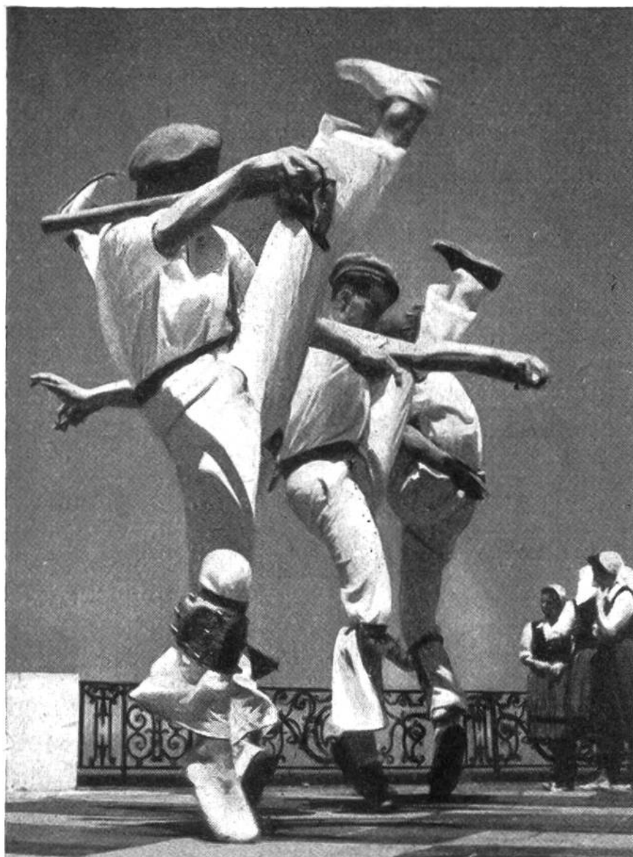
Diese wilde Ver- zückung heisst „Makil“ und ist nur d. Männern vorbehalten.

und Sinn heute längst nicht mehr vom Volk verstanden wird, lebt auch in den Tänzen der Basken an den Festen des Jahres wieder hell auf. Was einst ein religiöser Vorgang, Tanz zur Austreibung von Dämonen, zur Verehrung der Gottheiten und der Ahnenseelen war, das hat im Lauf der Jahrtausende den religiösen Sinn verloren und sich zum weltlichen Tanz bei Fest und Feier gewandelt. So bewundern wir bei den alljährlichen Festen der Basken Bogen-, Bänder- und Schwerttänze, die in ihren wilden Sprüngen, eindrucksvollen Figuren und Verzückungen noch vieles vom religiösen Ernst ihrer frühzeitlichen Übung bewahrt haben. Gewisse Tänze sind wie bei den Primitiven nur den Männern vorbehalten. Beim „Zamalzin“, einem alten Zauber- und Dämonentanz, wird der Böse Geist