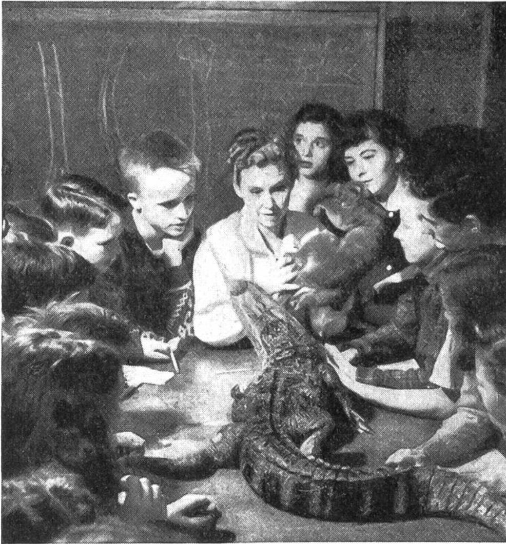
Nicht jeder Alligator ist so gutmütig, dass er sich auf diese Weise vorführen liesse.