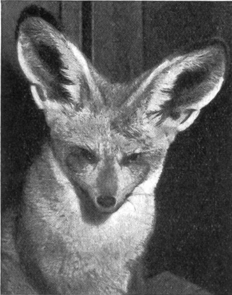
Von allen Hundarten hat der afrikanische Löffelhund die grössten Ohren.

schen noch nicht ausgerottet worden ist. Adler und andere Grossraubvögel stehen nicht immer von weitem auf ihr Opfer herunter, sondern streichen überraschend dicht über einen Bergkamm hinweg und stossen auf das völlig ahnungslose Beutetier. Die junge Gemse aber besitzt zur Sicherung vor derartigen Überempelungen ein so feines Gehör, dass sie sogar das Sausen der Schwingen von unsichtbaren, d. h. hinter