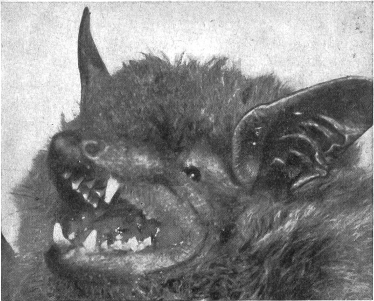
Die Fledermaus besitzt die allerempfindlichsten Ohren.

Insekten, besonders Heuschrecken. Im Steppengras stelzt er geräuschlos daher, lässt seine riesigen Ohrfächer spielen und stellt mit ihrer Hilfe fest, wo die fetten, zirpenden Insekten sitzen. Dann nähert er sich vorsichtig, bis er blitzschnell zuschnappen kann.