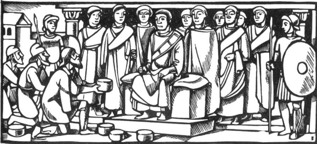
Konstantin der Grosse (306–337) nimmt die Gaben tributpflichtiger Völker entgegen.