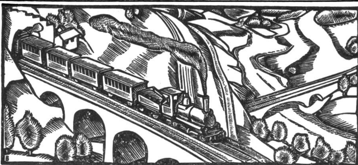
Die 1882 eröffnete Gotthardbahn hat 80 Tunnel und Galerien von zusammen über 46 km Länge und 1234 Brücken und Durchlässe. Sie fährt seit 1920 elektrisch.