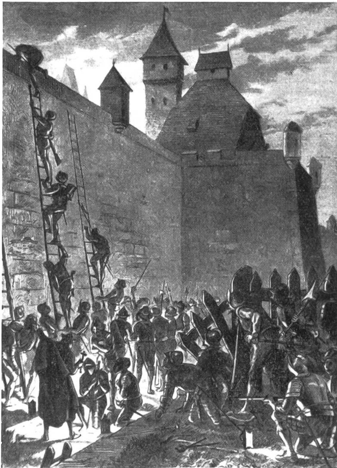
Die Escalade von Genf. Alljährlich am 12. Dezember feiern die Genfer das Ereignis der Escalade (= Ersteigung mit Sturmleitern) als die „wunderbare Errettung“ ihrer Stadt. Vor 350 Jahren, in der Nacht vom 11. auf den 12. Dezember 1602, versuchten Truppen des Herzogs Karl Emanuel I. von Savoyen die Stadt überraschend zu stürmen. Etwa 300 Mann erkletterten auf Leitern die Mauern und drangen in die Befestigungen ein. Doch die Genfer überwältigten die Angreifer in erbittertem Kampf. Der Sieg verhalf Genf zur Selbständigkeit (1603).