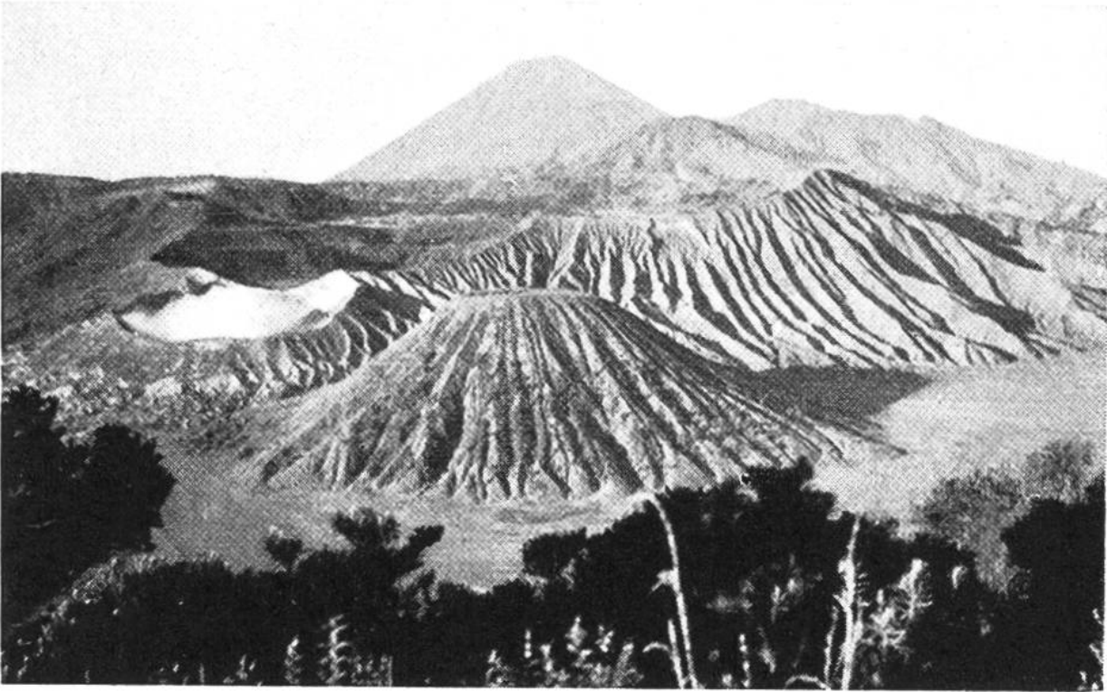
Landschaft beim Vulkan Bromo. Im Vordergrund erloschener Krater inmitten des Sandsees.

lend steht er da inmitten der unabsehbar weissen Wüste des Sandsees, die zu umreiten man gewiss vier bis fünf Stunden benötigen würde. Über die Lavamassen prüfen die Pferde jeden Schritt. Die 250stufige Treppe, die zum Kraterrand des Bromo führt, muss zu Fuss überwunden werden. Jetzt blickt der Tourist in den Krater. Rot, gelb, grün, blau lecken riesige Flammenzungen herauf. Es kracht und grollt in der Tiefe, prasselt und klopft, brodelt und kocht wie in einem Höllenschlund. Die Luft ist schwefeldurchtränkt, kleinere Magma-brocken, halbflüssiges Gestein des Erdinnern, fliegen bis zur halben Höhe des Kraters herauf, und es beschleicht den Beschauer jene verführerische Gewalt, die ihn hinunterziehen möchte in den verderblichen Abgrund. Er spürt es, der Vulkan will sein Opfer haben. Und in der Tat, noch heute gibt es Javaner, die dem Bromo opfern. Alljährlich findet ein Fest statt. Früher waren es Menschen, die dem Berg als Opfer dargebracht wurden, heute wirft man eine lebende Ziege in den Kraterschlund.