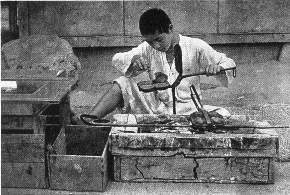
Dieser Jüngling bäckt mit seinem Waffeleisen Reiskuchen, die er an die Vorübergehenden verkauft.

entzogenen Pflanzennährstoffe oft nicht durch genügende Düngung zu ersetzen. Auf Kopf und Rücken schleppt er seine wenigen Erzeugnisse zum Händler oder auf den Markt, wo er sich meist mit einem recht bescheidenen Erlös zufrieden geben muss. Trotz unablässigem Mühen bringt es der koreanische Bauer daher nur selten zu einigem Wohlstand. A. B.