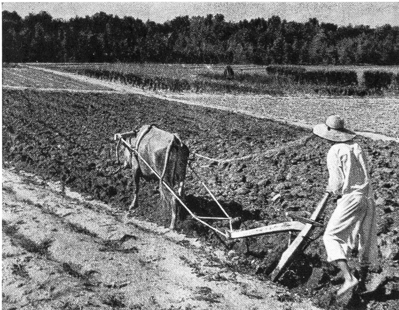
Ein Bild des Friedens. Koreanischer Bauer beim Pflügen mit einem altertümlichen, von einem Büffel gezogenen Pflug.