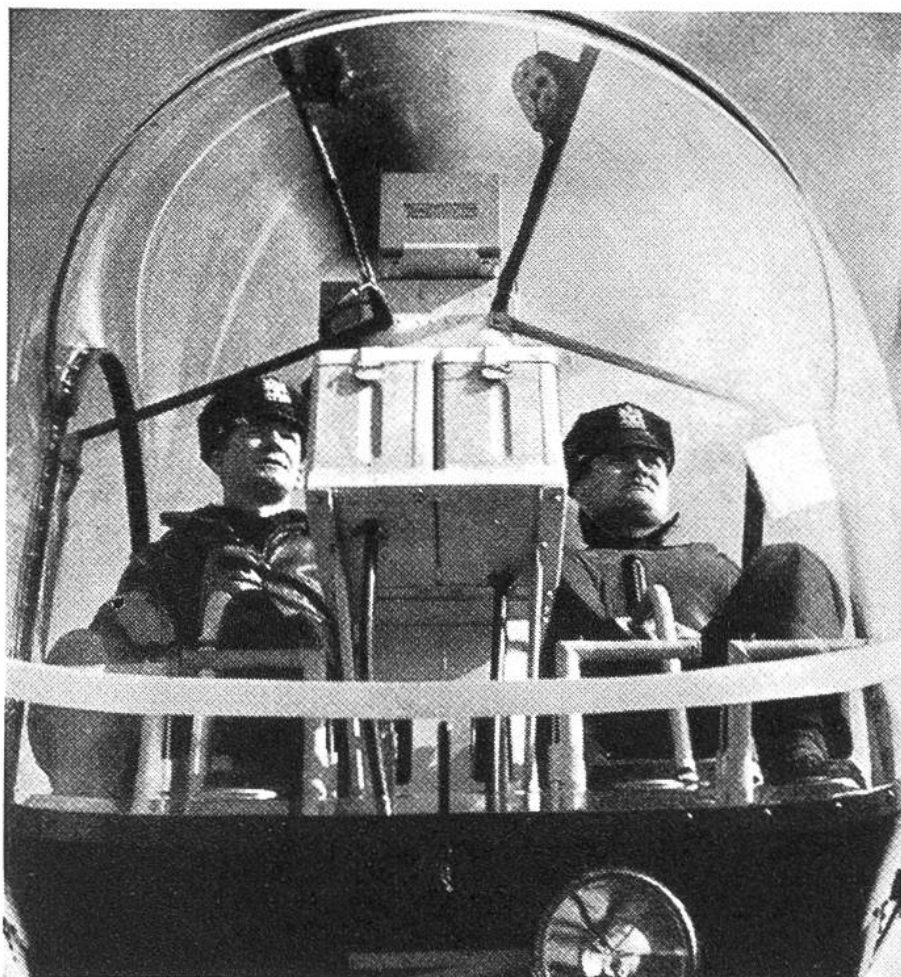
Der mit Glas umgebene Führerstand eines modernen Hubschraubers der New Yorker Verkehrspolizei. Der Kasten in der Mitte enthält die Radioausrüstung.