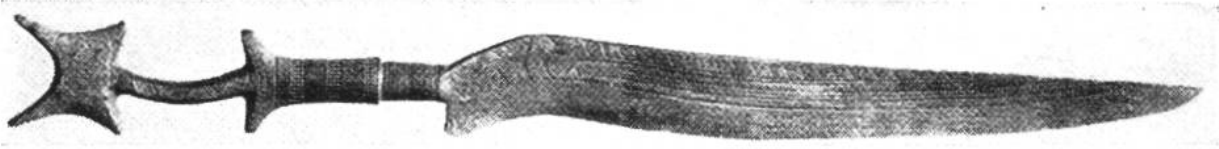
Bronzemesser mit Phantasiegriff.

gen; einzig die Eigenschaft der Giessbarkeit fehlt dem reinen Kupfer wegen zu starker Neigung zur Sauerstoffaufnahme und Blasenbildung beim Schmelzen. Die Legierungen dagegen, Bronze (gewöhnlich 90% Kupfer und 10% Zinn) und das dünnflüssigere Messing (Kupfer und Zink) sind giessbar. – Der Bronzeguss ist erst um 600 v. Chr. auf der Insel Samos erfunden worden; die ägyptischen Bronzen sind nicht gegossen, sondern aus Bronzeblech genietet.