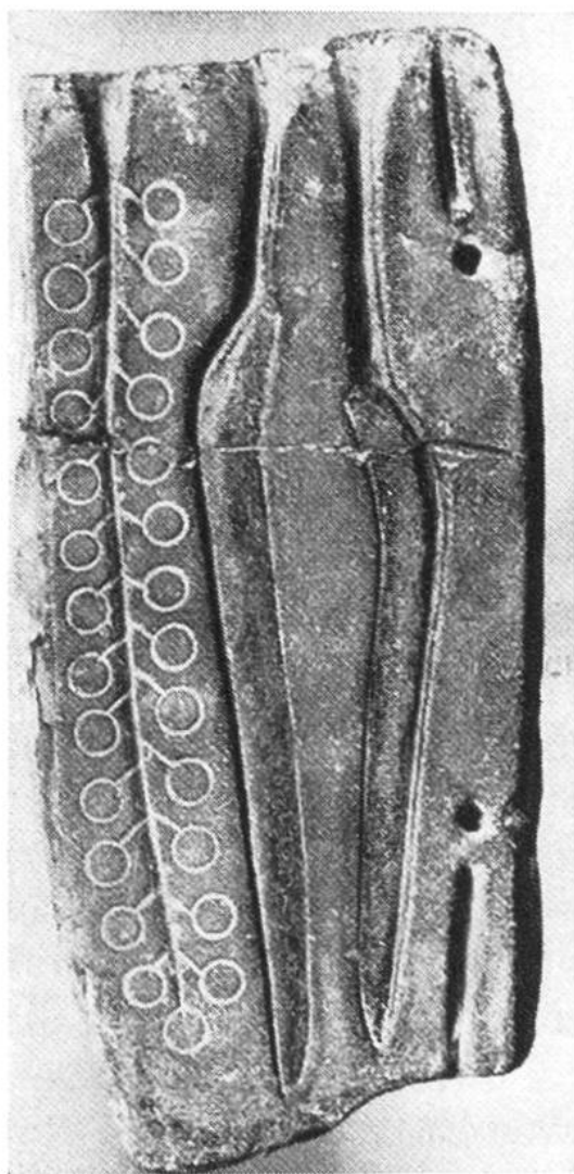
Hälfte einer Gussform aus Sandstein für Ringe und Messer, 9. Jahrhundert v. Chr.

Im Jahre 1946 wurden in einer Baugrube des Hauses Daxelhoferstrasse 17 in Bern aus einer 70 bis 100 cm tiefen, lehmigen Erdschicht zwei Dutzend Kupferbrocken ausgegraben. Diese Kupferstücke staken zwischen Holzkohleresten nahe beieinander in einer Grube. Die sorgfältige Untersuchung der Fundstelle durch einen Fachgelehrten ergab, dass es sich hier um Reste eines urzeitlichen Gussverfahrens handeln müsse und dass die Kupferbrocken als sogenannte Gusskuchen anzusehen seien, die auf das Vorhandensein einer Kupfergiesserei in der Vorzeit schliessen lassen. Die Fundstücke wurden