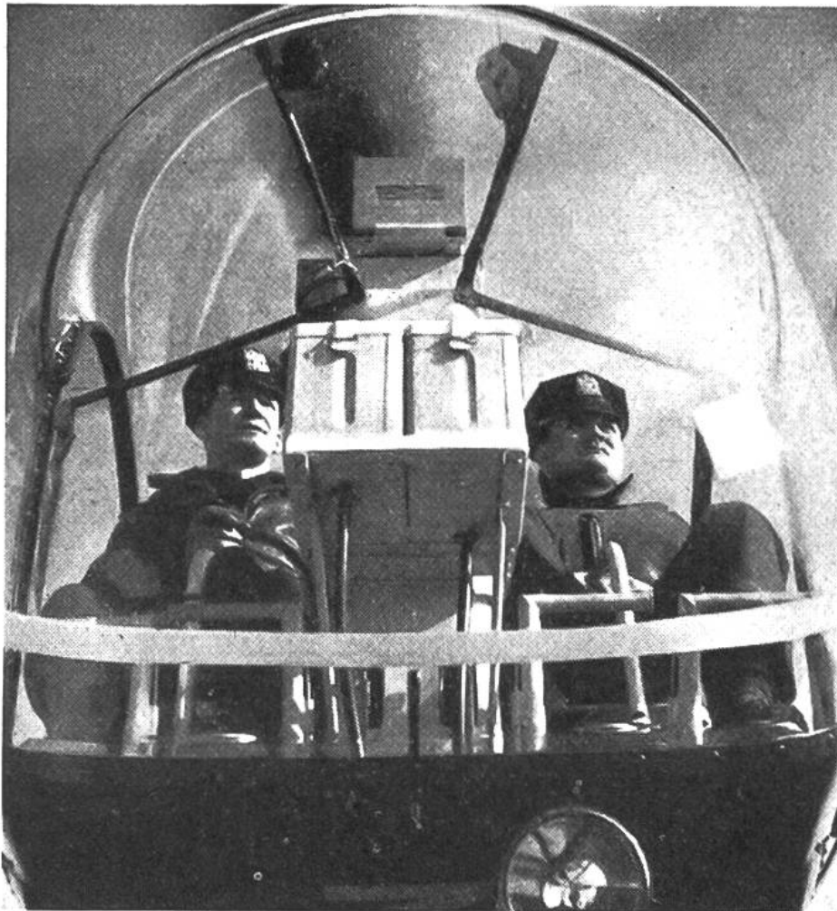
Der mit Glas umgebene Führerstand eines modernen Hubschraubers der New Yorker Verkehrspolizei. Der Kasten in der Mitte enthält die Radioausrüstung.