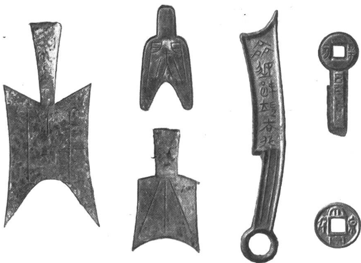
Chinesische Spaten-, Kleider-, Messer-, Schlüssel- und Rundmünzen der Chou- und Han-Dynastie und des Wu-Reiches.