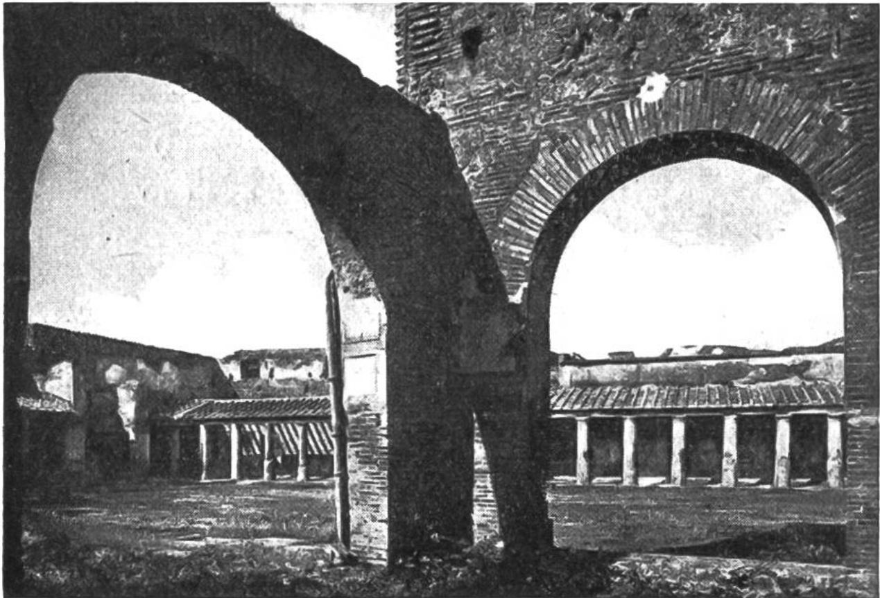
Die Stabianer Thermen aus dem 2. Jahrhundert v. Chr., die älteste der drei öffentlichen Badeanstalten in Pompeji. Rings um den Hof lagen die Auskleideräume, die Säle mit Warmluft (Tepidarium), für warme Bäder (Calidarium) sowie für kalte Bäder (Frigidarium).

len Gebäuden grossen Schaden an; aber die Einwohner gingen unverzüglich an den Wiederaufbau, denn ein Erdbeben ist in Süditalien nichts Ungewöhnliches. An ein vulkanisches Beben des Vesuvs aber dachte niemand. Seit undenklichen Zeiten hatte sich der Berg so ruhig verhalten, dass, abgesehen von einigen Naturforschern, kein Mensch den Vesuv für einen Vulkan hielt. Am 24. August des Jahres 79 n. Chr., mitten am Tage, begann der Berg plötzlich schwere Rauchwolken auszustossen. Die Sonne verfinsterte sich. Es grollte in den Tiefen der Erde. Der eigentliche Ausbruch erfolgte aber erst in der Nacht.