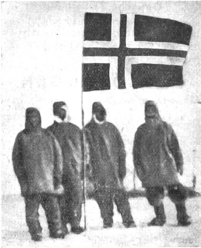
Die norwegische Flagge weht am Südpol.