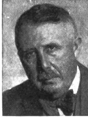
Eduard v. Steiger von Bern * 1881, seit 1941 im Amte Justiz-u. Polizeid.