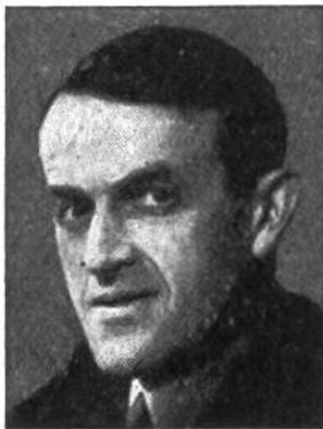
Dr. M. Petitpierre von Couvet (Nbg.) * 1899, seit 1945 im Amte Polit. Departem.

Bei Druck- legung dieses Kalenders ist die Wahl des 7. Bun- desrates für den zurückgetrete- nen Bundesrat Celio noch nicht erfolgt. Klebe selbst ein Bild des neuen Bun- desrats hier ein.