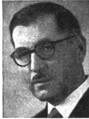
Dr. Karl Kobelt von Marbach (St. G.) * 1891 seit 1941 i. Amte Militärdepartem.