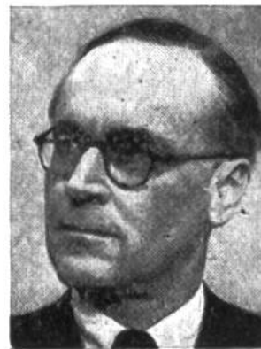
Dr. R. Rubattel v. Villarzel (Vd.) * 1896, seit 1948 im Amte Volkswirtschaft

Bei Druck- legung dieses Kalenders ist die Wahl des 7. Bun- desrates für den zurückgetrete- nen Bundesrat Celio noch nicht erfolgt. Klebe selbst ein Bild des neuen Bun- desrats hier ein.