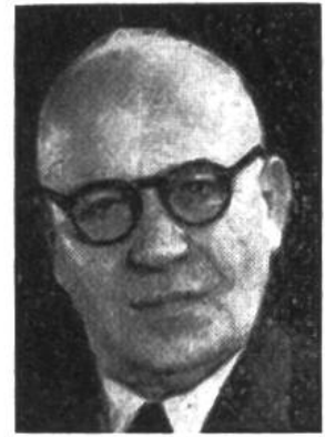
Ernst Nobs von Zürich * 1886, seit 1944 im Amte Finanz-, Zolldep.