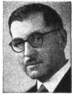
Dr. Karl Kobelt von Marbach (St. G.) * 1891 seit 1941 i. Amte Militärdepartem.