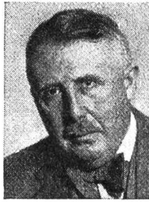
Eduard v. Steiger von Bern * 1881, seit 1941 im Amte Justiz- u. Polizeid.