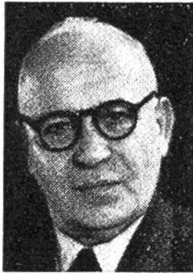
Ernst Nobs von Zürich * 1886, seit 1944 im Amte Finanz-, Zolldep.