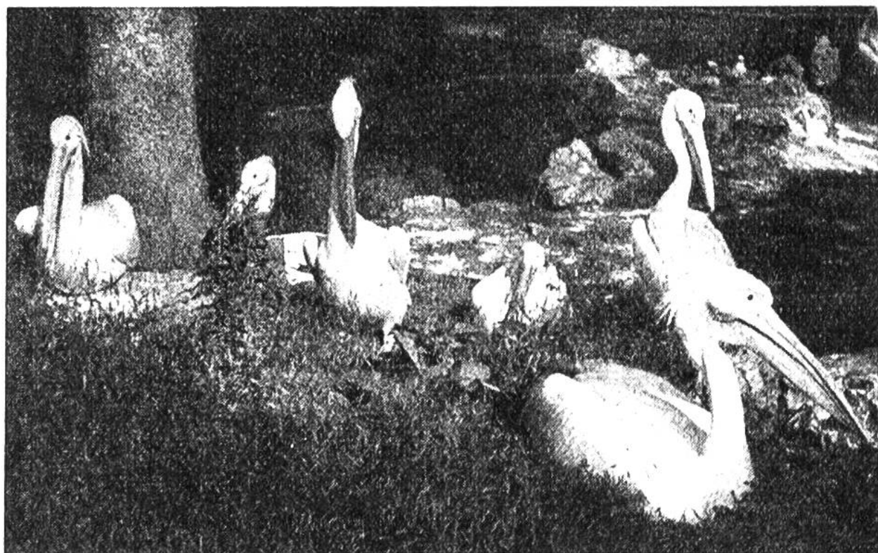
Rosenpelikane im Basler Zoologischen Garten.

Niststellen. Der Kopf mit dem ungewöhnlich langen Schnabel wird beim Fliegen auf die Schulter zurückgezogen, und oft bilden die Pelikane hoch in der Luft riesige Geschwader, die in tadelloser Formation ihre Kreise ziehen. Das Rauschen ihrer Schwingen, die zu mächtigen Tragflächen ausgespannt sind, hört man weithin auf der Erde.