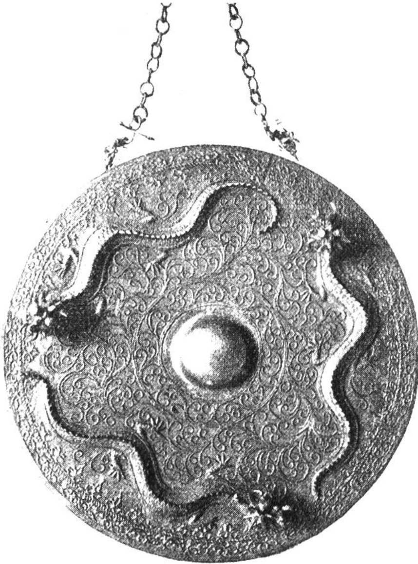
Gong von der Südseeinsel Borneo, ein kunstvoll gearbeitetes Schlagbeken aus Bronze.