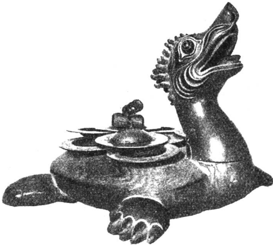
Balinesisches Musikinstrument aus hartem, braunem Holz und Messing.

schauungen und Überlieferungen und war darum schön und echt.