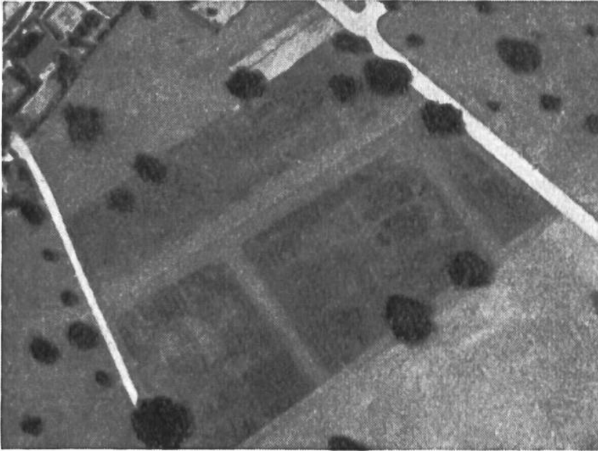
Vergrößerung aus der nebenstehenden Abbildung, auf welcher die Spuren der römischen Gebäude und Strassen noch deutlicher erkennbar sind.

aus unserer Vor- und Frühgeschichte, die nicht im geringsten über die Erdoberfläche hervortreten, vom Flugzeug oder in seltenen Fällen auch von einem Berge aus so deutlich erkennbar sind? Das hat zwei Gründe. Erstens können sie sich durch Verfärbungen des Erdreichs abzeichnen. Nehmen wir an, es habe einst an einer Stelle, wo jetzt ein Acker liegt, ein Dörfchen gestanden. Es ist klar, dass die vielen Abfälle, die tagtäglich aus Küche und Stall hinausgebracht wurden, das Erdreich in der Umgebung veränderten, so dass heute dunkle Flecken verraten, wo einst Menschen lebten. Der zweite Grund liegt darin, dass der Bodeninhalt auch den Pflanzenwuchs beeinflussen kann. Wenn zum Beispiel eine römische Strasse mitten durch ein modernes Getreidefeld führt, ist das Korn natürlich links und rechts anders geartet als dort, wo das steinige Strassenbett im Boden verborgen ist. Auf diese Weise vermögen Fliegeraufnahmen der Urgeschichtsforschung sehr wichtige Hinweise zu geben, die dann allerdings immer durch Grabungen nachgeprüft werden müssen. Die Schweizerische Gesellschaft für Urgeschichte hat deshalb eine Vermittlungsstelle für Fliegeraufnahmen eingerichtet, die den Forschern die gewünschten Unterlagen verschaffen soll.