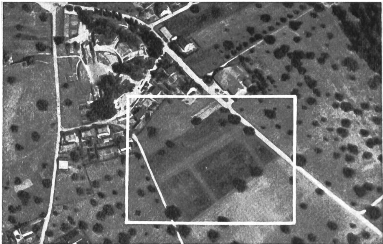
Fliegeraufnahme der alten Römerstadt Augusta Raurica. Im Pflanzenwuchs zeichnen sich helle Flecken und Linien ab, die das Vorhandensein von oberflächlich nicht mehr sichtbaren Gebäuderesten und Strassenzügen verraten.

übersehen. Was beispielsweise dabei herauskam, zeigen unsere beiden Abbildungen, bei denen es sich um ein Luftbild der alten Römerstadt Augusta Raurica bei Basel aus 1000 m Höhe und um einen vergrösserten Ausschnitt derselben Aufnahme handelt. Auf den ersten Blick fällt uns auf, dass sich an vielen Stellen, ganz besonders aber rechts unterhalb des Theaters (innerhalb des weiss umrahmten Rechtecks, das der Vergrösserung auf unserem zweiten Bild entspricht) merkwürdige Linien und Zeichen finden. Nun, die Erklärung ist nicht schwierig: hier stecken in der Erde überall römische Gebäudereste, die sich solcherweise abzeichnen. Der Beweis für die Richtigkeit dieser Behauptung ist schnell erbracht. An einigen Orten wurden die Mauerzüge bereits durch Sondierungen nachgewiesen, und der aufgenommene Plan stimmt haargenau mit den Zeichen an den betreffenden Stellen der Fliegeraufnahme überein.