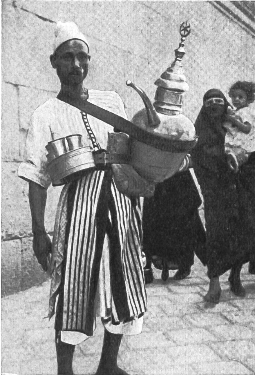
Ein Wasserträger verkauft das kostbare Nass in den Strassen Kairo.

Rom besass die weithin sichtbaren Aquaedukte, die das Land als hochgebaute Wasserstrassen durchzogen. Heutzutage werden die lebenswichtigen Reservoirs und Filtrieranlagen unterirdisch angelegt. Bewässerungsanlagen gehören also zu den notwendigsten Errungenschaften des Menschen.