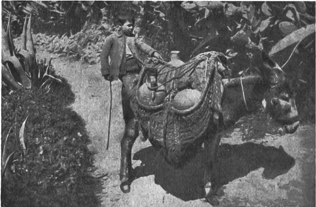
Dieser kleine spanische Esel transportiert das Wasser in Tongefäßen, die in eigenartig geflochtenen Satteltaschen stecken.

serverkäufer zum charakteristischen Strassenbild: In Kairo wird das köstliche Gut in Tierhäuten und Messingkrügen zu Märkte getragen; in Nordafrika und Südspanien sind es die hübsch verzierten und reizvoll geformten Tonkrüge, die das Wasser enthalten; in der Türkei wird es in riesigen Glasflaschen – ähnlich unseren Chiantiflaschen – verladen und gilt je nach der Gegend, aus der es stammt, als mehr oder weniger köstlich, ganz so, wie bei uns die Weine nach der Herkunft aus verschiedenen Gegenden bewertet werden. Ein moderner Wasserverkäufer schafft sich wohl auch einen Wasserwagen an, dem er als Wahrzeichen einen Behälter mit lebenden Goldfischen aufsetzt, und der Durstige kann sich, wie in unseren Großstädten am Eiswagen stehend, an einem Glas Wasser erlaben.