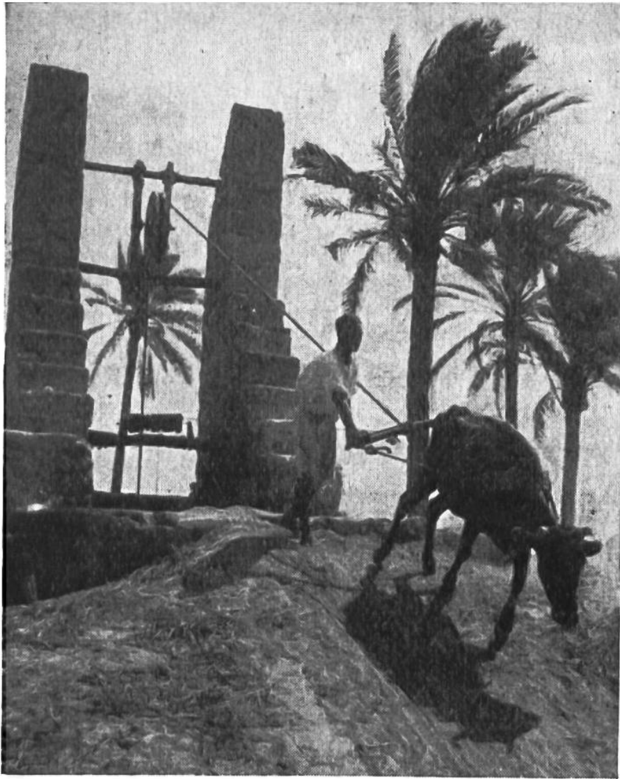
Ein Ochse dient als, Zugtier', um Wasser aus der Tiefe des Ziehbrunnens einer Oase bei Tripolis zu schöpfen.