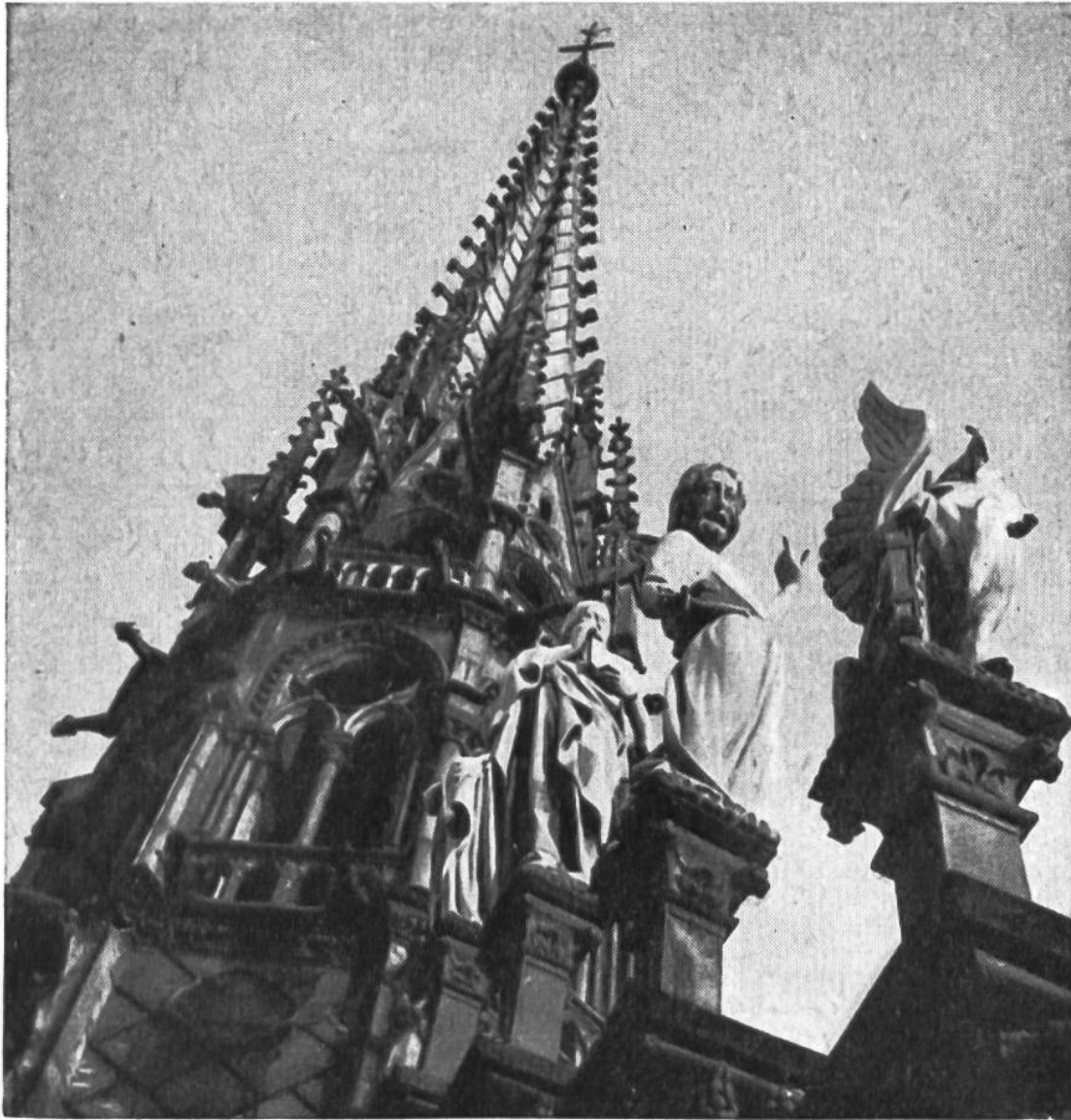
Der Vierungsturm über dem Hauptschiff könnte an Ausmass einen ganzen Münsterturm abgeben. Er ist von den gewaltigen Figuren der 12 Apostel umkränzt.

krönenden Helm der Türme, stellen die Bauten mit ihrem Schmuck an Bildereien in Stein, Holz, Glas und edlen Metallen „vollkommene“ Kunstwerke dar.