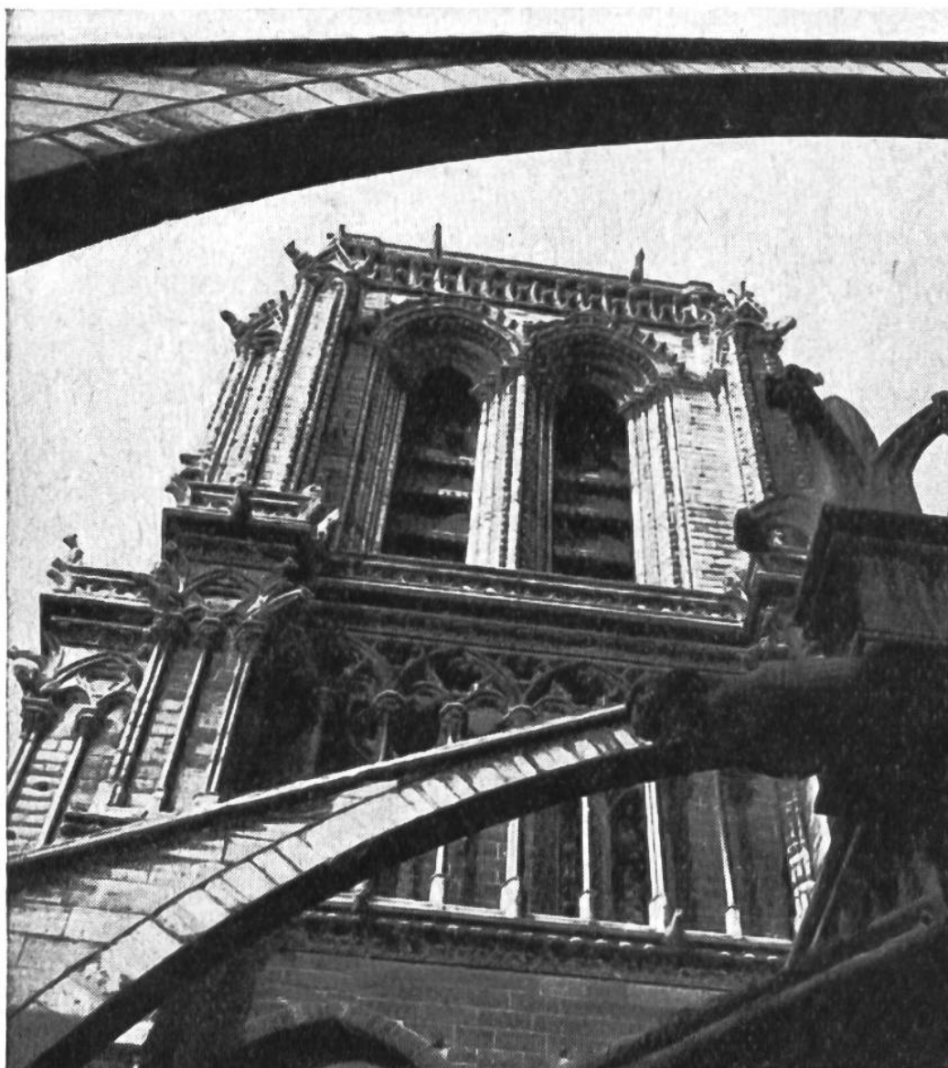
Ein Blick durch die steinernen Verstreben der ersten Galerie nach der Höhe eines der Haupttürme.

geldraubendes Wirken an der Krönung und Mitte der Stadt zuliess. Unzählige Bauknechte und Steinmetzen wurden von der Bürgerschaft beschäftigt, um nach grosszügigem Plan Dome aufzurichten, welche Gottes und der Stadt steinernes Preislied darstellten. Mächtige Säulenbündel, feinste Bogen, wuchtige Strebepfeiler, zierliche Dachreiter, groteske Wasserspeier, hohe Fenster und prächtige Tore: sie zu schaffen, brauchte es kühne Baumeister und sorgsame Kleinkünstler. Nicht ohne Grund reichten in zahlreichen Fällen Geld und Zeit nicht aus, die herrlich geplanten Bauten zu Ende zu führen. Aber auch in unfertigem Zustand, vielfach ohne den