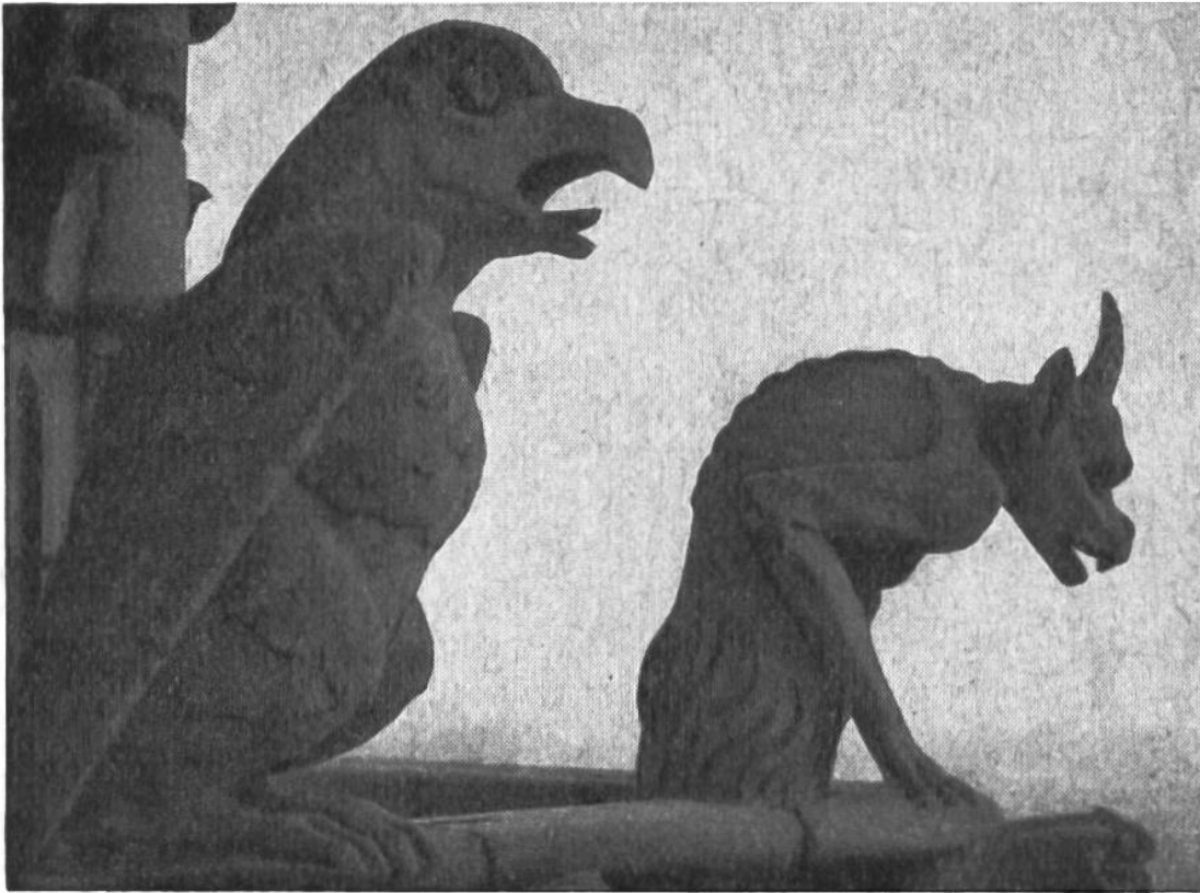
Die fast unbegrenzte Phantasie mittelalterlicher Steinhauerkunst schuf als Schmuck des heiligen Baus die sonderbarsten Tiergestalten.

doch unvollendeten Haupttürmen, dem über den Schiffen 90 Meter in den Himmel aufstrebenden Vierungsturm, der berühmten Fassade mit Portalen und grosser Rosette, den Statuen und Wasserspeiern. Im Jahre 1163 wurde von Papst Alexander III. und König Ludwig VII. der Grundstein gelegt, und nach 80jähriger Bauzeit war das riesige Bauwerk erst in seinen Grundlinien fertig. Immer wieder wurde – wie bei den meisten gotischen Kirchen – angebaut und aufgestockt, verziert und ausgebessert. Die im letzten Jahrhundert vorgenommene allgemeine Restauration nahm 20 Jahre in Anspruch. Die letzten Kriege, welche so viele Kirchen und Kunstdenkmäler vernichteten, überlebte die nach der Mutter Gottes benannte Kathedrale Notre Dame ohne Schädigung, und der von buntem Licht durchwobene Innenraum ist den Frommen derselbe heilige Zufluchtsort geblieben, während durch die Jahrhunderte vor den Portalen draussen der Schauplatz für Revolutionen, Enthauptungen und Truppenparaden wechselte.