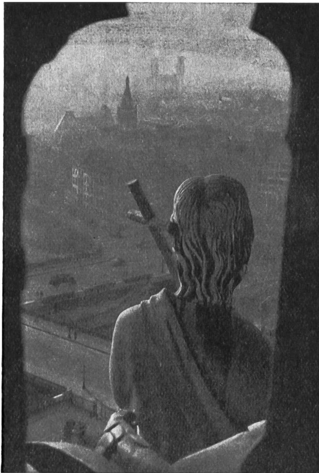
Aus frommer Höhe blicken die Statuen von Aposteln und Heiligen von den Türmen und Galerien der Kathedrale Notre Dame weit über das Häusermeer der Seine-Stadt Paris.

Klöster des Frühmittelalters noch den schlichten romanischen Baustil, so wandte sich der Bürger mit Vorliebe einem neuen, dem gotischen Stil zu, der ein hingebungsvolles, zeit- und