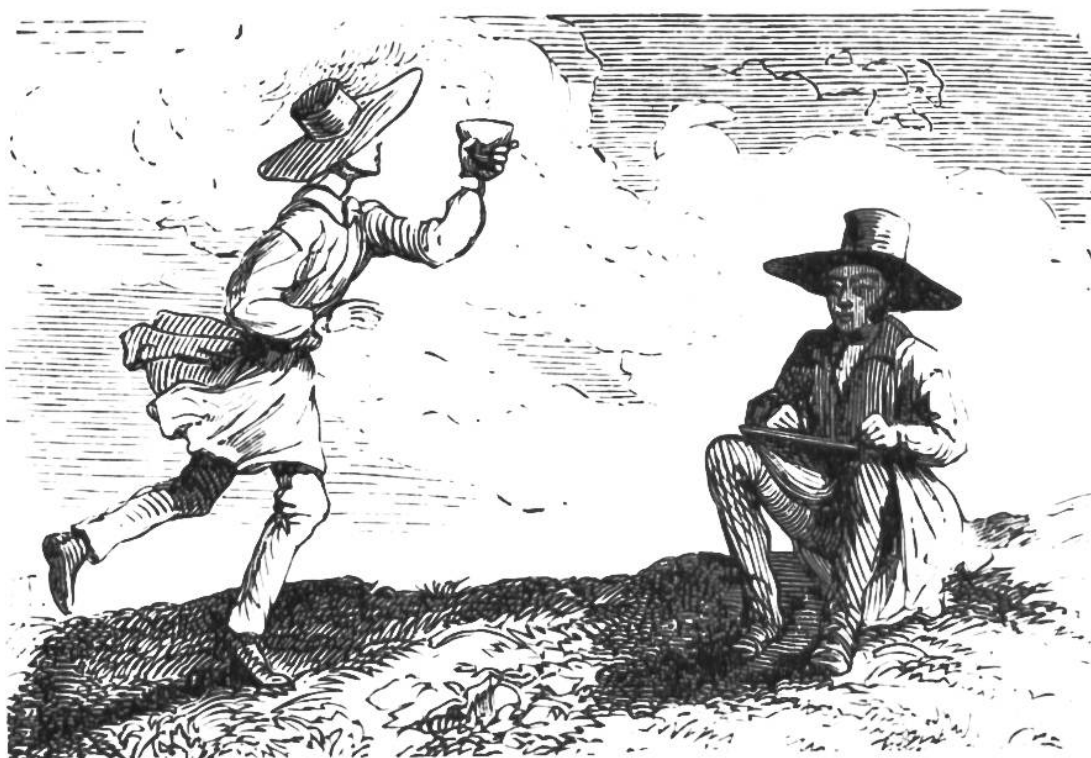
Rudolf Töpffer beim Zeichnen im Val de Trient. Ein Schüler bringt ihm eine Tasse dampfender Bouillon.

Jedes Jahr machte er mit seinen Schülern grosse Ausflüge, was für die damalige Zeit etwas ganz Neues bedeutete. Er