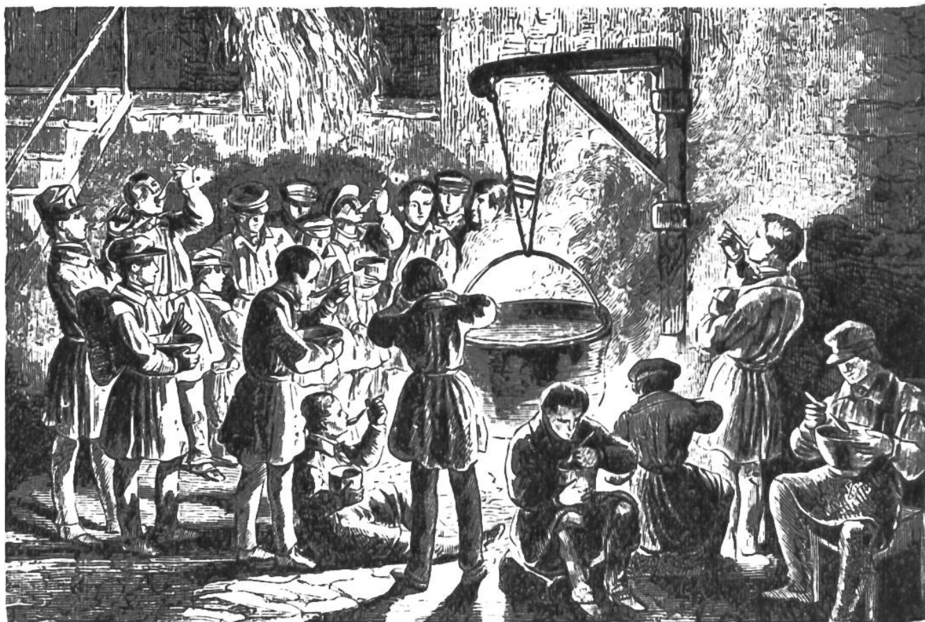
Frühstück im Chalet Ferret während einer Ferienreise ins Mont-Blanc-Gebiet.

Ausserdem schrieb Töpffer eine Anzahl Novellen, die später unter dem Titel „Nouvelles genevoises“ vereinigt wurden. Er verfasste auch humoristische, mit Karikaturen geschmückte Geschichten, in denen er mit feiner Ironie und köstlicher Phantasie die menschlichen Schwächen schilderte; die bekanntesten sind: M. Cryptogame, M. Vieux-Bois, Dr. Festus, M. Crépin. Seine Werke wurden in viele Sprachen übersetzt.