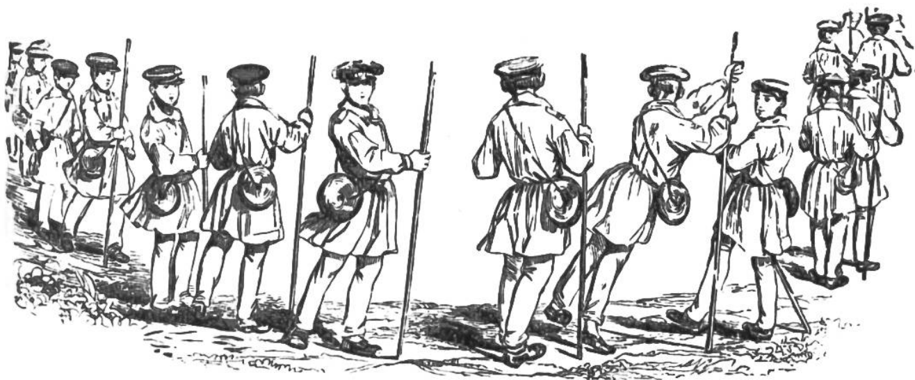
Die Schüler Rudolf Töpffers brechen zu einer Ferienwanderung auf: Abmarsch zum Pragelpass.