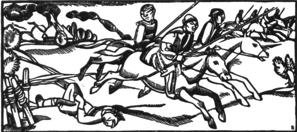
Mongolenvölker dringen in Europa ein.

oberung Galliens durch Julius Cäsar. 49–45 Bürgerkrieg zw. Cäsar u. Pompejus. Triumvirat. 44 Ermordung Cäsars. 30–476 n. Chr. Rom unter Kaisern. 29 Augustus röm. Kaiser. Blüte der römisch. Literatur. Virgil, Ovid, Horaz, Titus Livius. Nach Christus. 9 Der röm. Feldherr Quintilius Varus wird vom Cheruskerfürsten Arminius (Hermann) im Teutoburgerwalde besiegt. 64–311 Zeit der Christenverfolgungen durch verschiedene römische Kaiser. 69 Helvetischer Aufstand, Julius Alpinus. 313 Kaiser Konstantin erhebt das Christentum z. Staatsreligion. 337 Teilung des röm. Reiches. 375 Beginn d. Völkerwanderung.