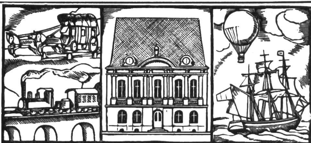
1874 wurde in Bern der Weltpostverein gegründet. (Bildmitte: Gründungsstätte an der Zeughausgasse.)