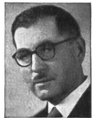
Dr. Karl Kobelt von Marbach (St. G.) * 1891 seit 1941 i. Amte Militärdepartem.