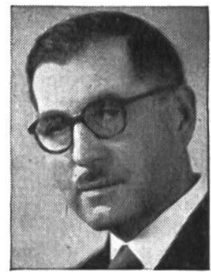
Dr. Karl Kobelt von Marbach (St. G.) * 1891 seit 1941 i. Amte Militärdepartem.