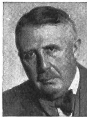
Eduard v. Steiger von Bern * 1881, seit 1941 im Amte Justiz-u. Polizeid.