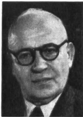
Ernst Nobs von Zürich * 1886, seit 1944 im Amte Finanz-, Zolldep.