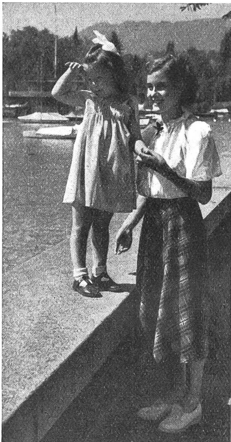
Das Jupe aus kariertem Stoff fällt schön gleichmässig gewellt.

Nun werden die Ärmel genäht, oben und unten eingereiht und in die Bluse gesteppt. An den vorderen Ärmelrand kommt ein Bündchen von 1 cm fertiger Breite. Nachdem der Halsausschnitt mit einem Streifen (fertige Breite 1 cm) eingefasst ist, wird die Rüsche gerichtet und darauf aufgesteppt. Nun sind noch die Knopflöcher in der Mitte der Tollfalte anzubringen und die Knöpfe anzunähen. Unter der Rüsche und in der Taille wird die Bluse mit je einem Druckknopf geschlossen. Eine kleine Masche aus schwarzem Samt macht einen netten Abschluss.