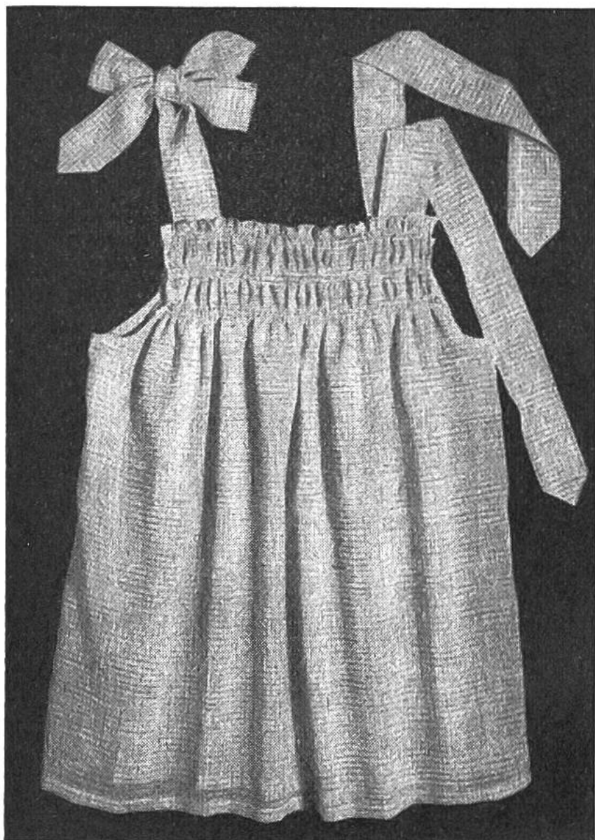
Das Trägerröckli aus Voile.

5. Die Träger sind auf eine fertige Breite von 3\frac{1}{2} cm zu nähen; das eine Ende wird jeweils zu einer Spitze ausgearbeitet. Die Träger werden in einem Abstand von 1 cm, vom Armloch aus gemessen, an Vorder- und Rückenteil angenäht.