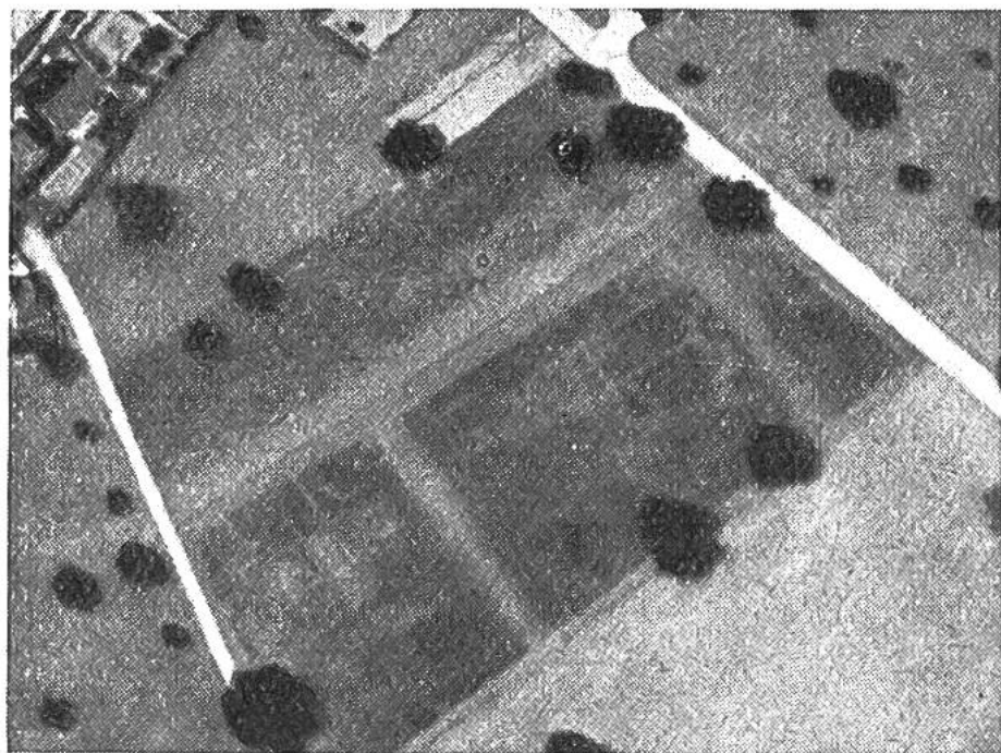
Vergrößerung aus der nebenstehenden Abbildung, auf welcher die Spuren der römischen Gebäude und Strassen noch deutlicher erkennbar sind.

aus unserer Vor- und Frühgeschichte, die nicht im geringsten über die Erdoberfläche hervortreten, vom Flugzeug oder in seltenen Fällen auch von einem Berge aus so deutlich erkennbar sind? Das hat zwei Gründe. Erstens können sie sich durch Verfärbungen des Erdreichs abzeichnen. Nehmen wir an, es habe einst an einer Stelle, wo jetzt ein Acker liegt, ein Dörfchen gestanden. Es ist klar, dass die vielen Abfälle, die tagtäglich aus Küche und Stall hinausgebracht wurden, das Erdreich in der Umgebung veränderten, so dass heute dunkle Flecken verraten, wo einst Menschen lebten. Der zweite Grund liegt darin, dass der Bodeninhalt auch den Pflanzenwuchs beeinflussen kann. Wenn zum Beispiel eine römische Strasse mitten durch ein modernes Getreidefeld führt, ist das Korn natürlich links und rechts anders geartet als dort, wo das steinige Strassenbett im Boden verborgen ist. Auf diese Weise vermögen Fliegeraufnahmen der Urgeschichtsforschung sehr wichtige Hinweise zu geben, die dann allerdings immer durch Grabungen nachgeprüft werden müssen. Die Schweizerische Gesellschaft für Urgeschichte hat deshalb eine Vermittlungsstelle für Fliegeraufnahmen eingerichtet, die den Forschern die gewünschten Unterlagen verschaffen soll.