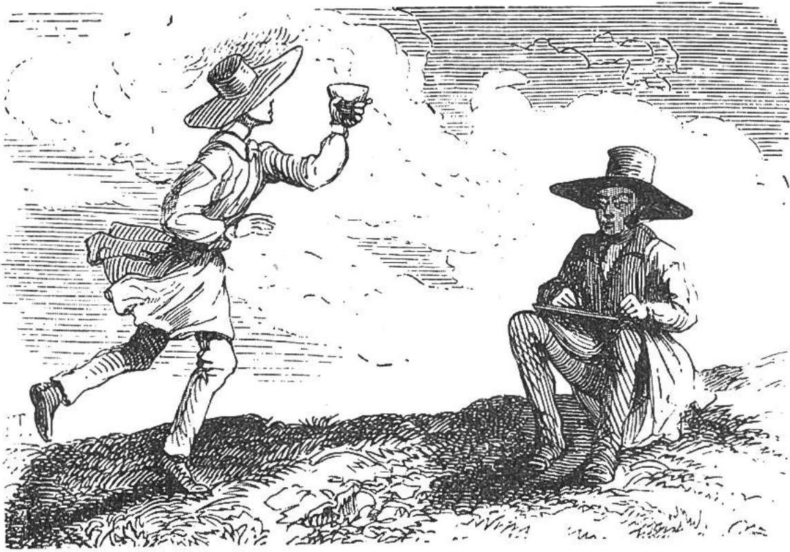
Rudolf Töpffer beim Zeichnen im Val de Trient. Ein Schüler bringt ihm eine Tasse dampfender Bouillon.

Jedes Jahr machte er mit seinen Schülern grosse Ausflüge, was für die damalige Zeit etwas ganz Neues bedeutete. Er