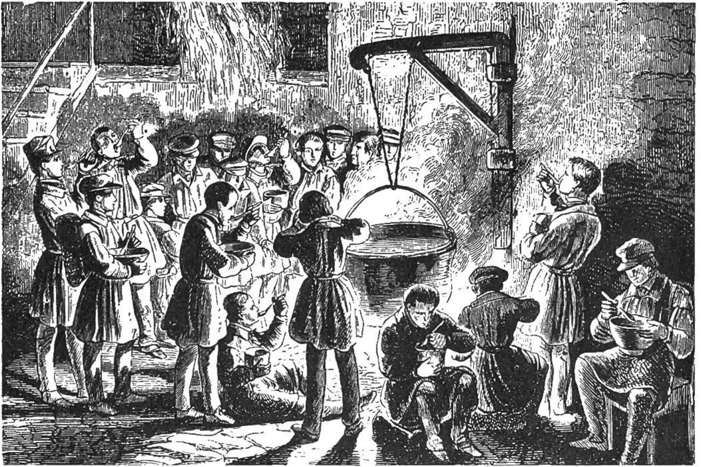
Frühstück im Chalet Ferret während einer Ferienreise ins Mont-Blanc-Gebiet.

Ausserdem schrieb Töpffer eine Anzahl Novellen, die später unter dem Titel „Nouvelles genevoises“ vereinigt wurden. Er verfasste auch humoristische, mit Karikaturen geschmückte Geschichten, in denen er mit feiner Ironie und köstlicher Phantasie die menschlichen Schwächen schilderte; die bekanntesten sind: M. Cryptogame, M. Vieux-Bois, Dr. Festus, M. Crépin. Seine Werke wurden in viele Sprachen übersetzt.