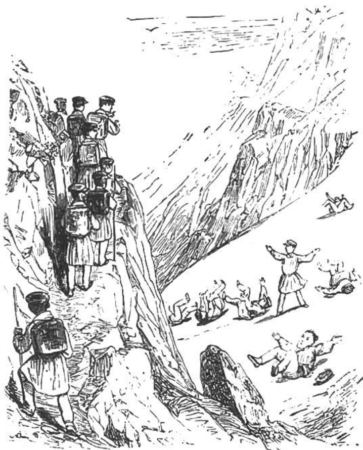
Abstieg von der Furka. Eine lustige Abwechslung bringt das Abrutschen auf den Schneefeldern.

entschloss sich zum Lehrerberuf. Nach einem Aufenthalt in Paris gründete er 1824 in Genf ein Pensionat für Jünglinge, das sich bald eines guten Rufs erfreute. Arbeit und Sorge fehlten in seinem Leben nicht – er war Vater von vier Kindern – aber er wusste die Stunden der Freude zu geniessen.