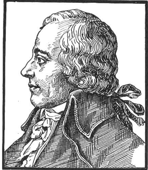
Pierre Simon Laplace,

(200. Geburtstag am 17. Mai) englischer Arzt, Begründer der Pockenschutzimpfung, * 17. Mai 1749 in Berkeley, † 26. Januar 1823 daselbst, war seit 1772 Wundarzt. Eine Bäuerin machte ihn darauf aufmerksam, dass Melker, die ungefährliche Kuhpocken gehabt hatten, gegen Menschenpocken (Blattern) unempfindlich seien. Diese Beobachtung führte Jenner zur Schutzimpfung, die er 1796 erstmals und mit Erfolg anwendete. Dank der bald in der ganzen Welt eingeführten Schutzimpfung ist die gefährliche Seuche, die in Europa jährlich ca. 400 000 Todesopfer gefordert hatte, heutzutage fast ganz verschwunden. Das engl. Volk ehrte Jenners Verdienste durch zwei grosse Geldspenden.