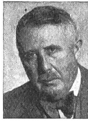
Eduard v. Steiger von Bern * 1881, seit 1941 im Amte Justiz u. Polizeid.