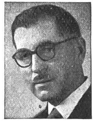
Dr. Karl Kobelt von Marbach (St.G.) * 1891 seit 1941 i. Amte Militärdepartem.