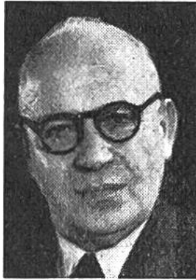
Ernst Nobs von Zürich * 1886, seit 1944 im Amte Finanz-, Zolldep.