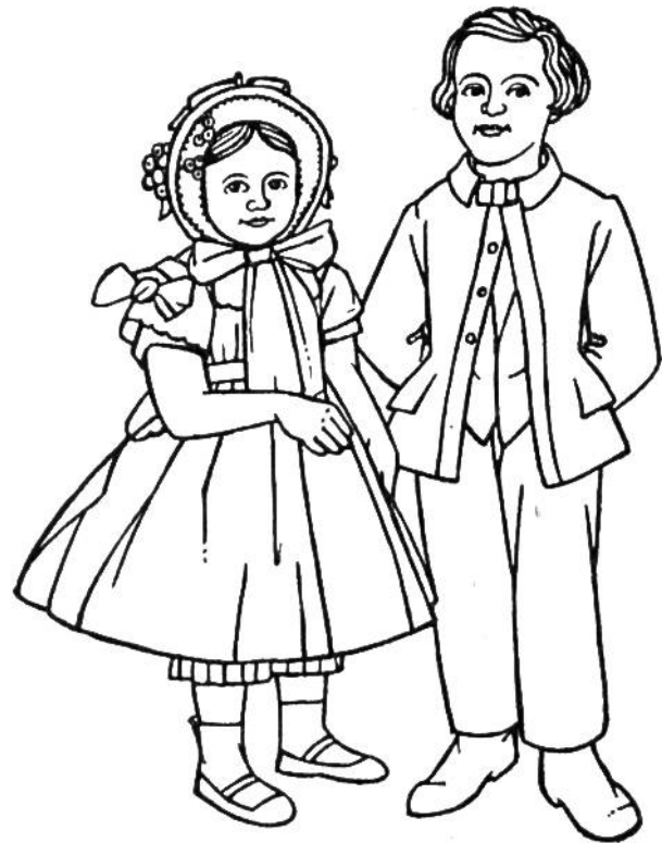
Kleidung um 1860.