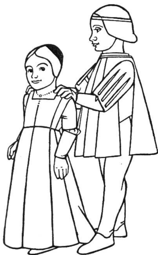
Kleidung zur Renaissance- Zeit in Italien, 1470.