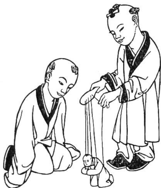
Chinesenkinder beim Marionettenspiel.