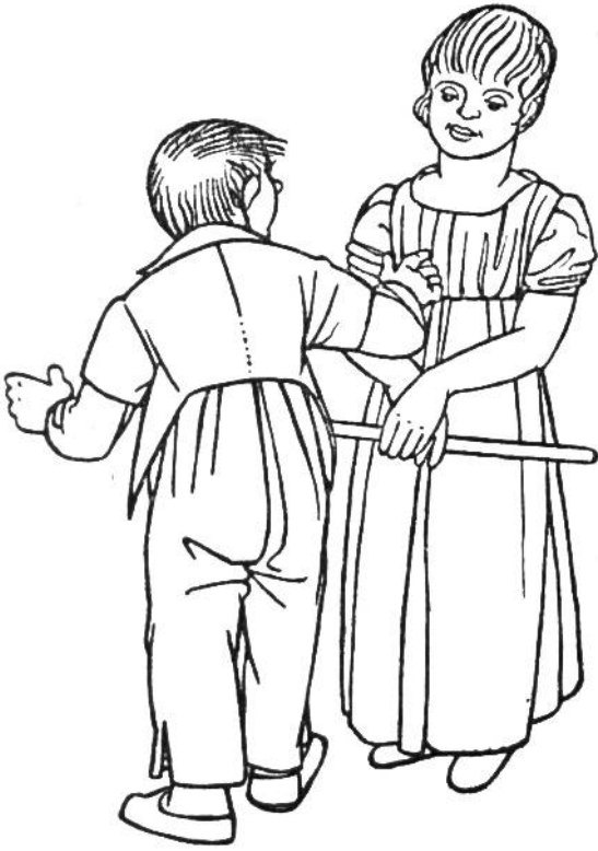
Kinderkleidung zur Zeit der Empire-Tracht, um 1808.