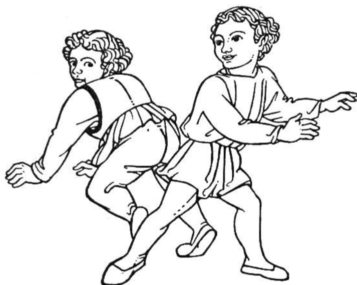
Kindertracht zur Spät- gotik-Zeit 1420.