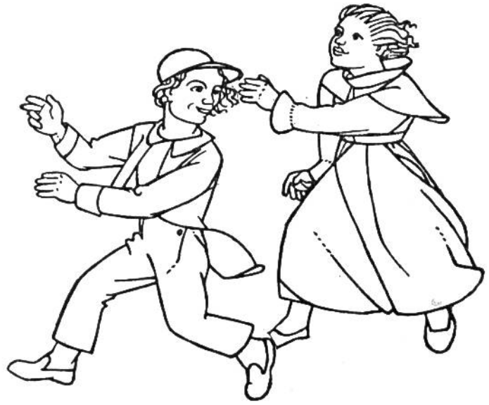
Tracht zur Biedermeierzeit, 1820.