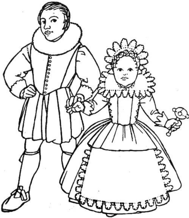
Kleidung von Kindern um 1620 (Holland, Spanien).