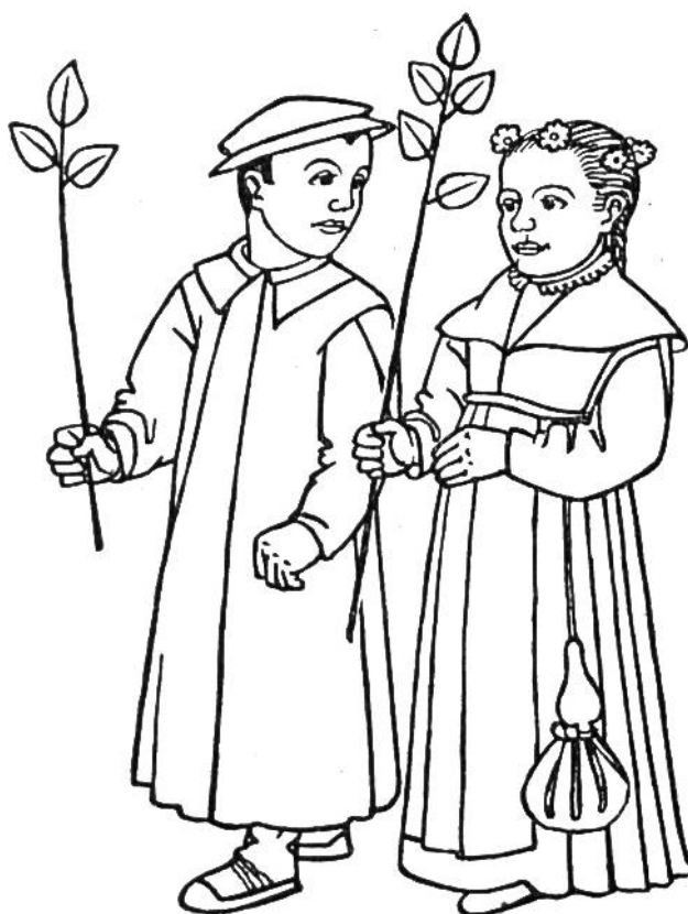
Tracht der Spät-Renaissance in der Schweiz, 1559.