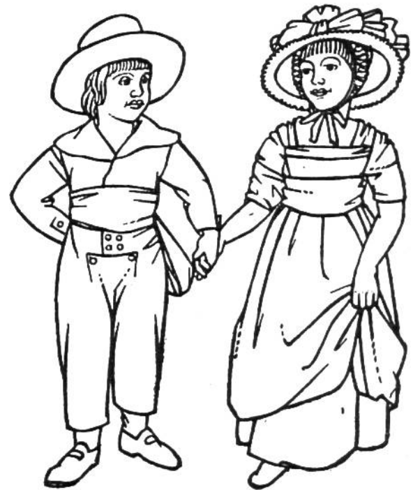
Kinderkleidung um 1780.