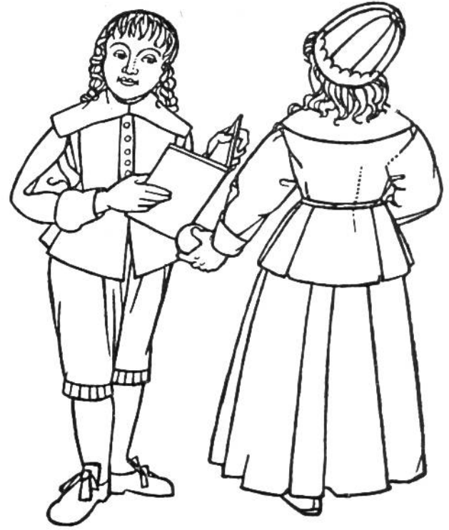
Tracht zur Barock-Zeit, um 1650.