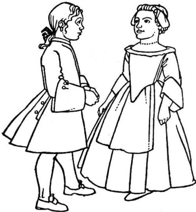
Rokoko-Zeit, um 1770.